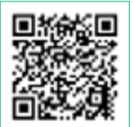
東松島市 ワクチン予約サイト