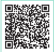
接種券発行申請サイト

既に対象者の方に接種券を発送済みです。 なお、対象の方でオミクロン株対応ワクチンを未接種の方はお手持ちの接種券を使用できます。 64歳以下かつ接種の対象の方でまだ接種券が届かない方は、右上QRコードまたはコールセンターに電話で申請していただくようお願いいたします。