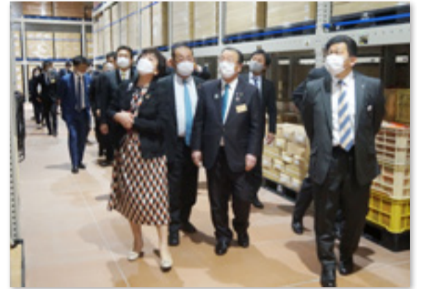
▲防災拠点備蓄倉庫を視察