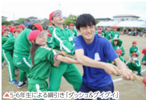
▲5・6年生による綱引き「ダッシュ&グイグイ」