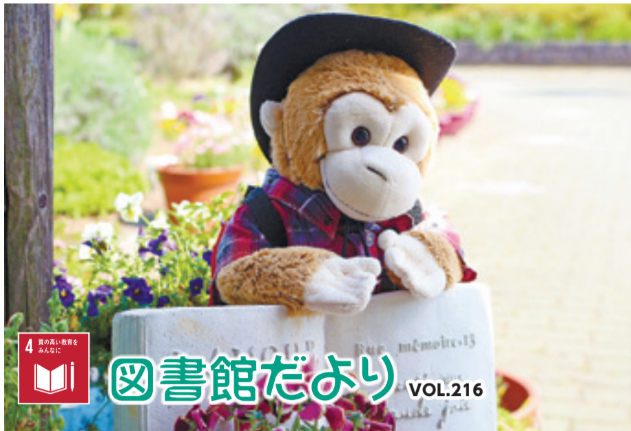
▲30周年企画中!おさるさんもお待ちしています