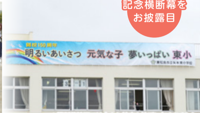
記念横断幕をお披露目