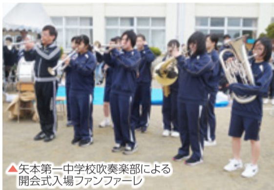
▲矢本第一中学校吹奏楽部による開会式入場ファンファーレ