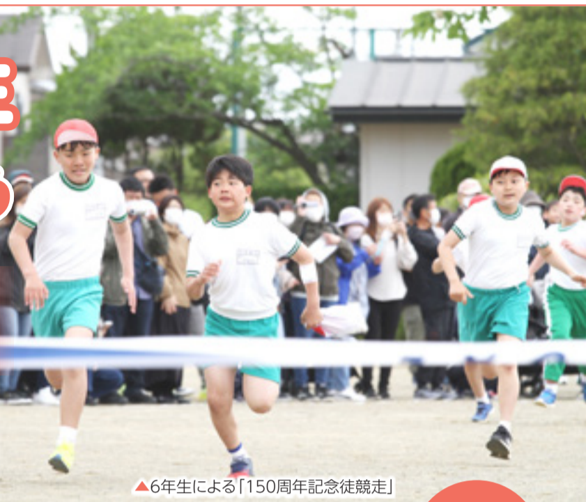
▲6年生による「150周年記念徒競走」

開校150周年イヤーを迎えた矢本東小学校の運動会では、矢本第一中学校吹奏楽部をはじめ生徒有志が小中連携の一環として参加しました。児童会でスローガンやデザインを考えた記念の横断幕をお披露目。徒競走や綱引き、大玉転がしなど各種競技で盛り上がり、中学生や保護者参加型の競技も盛り込まれました。 (5月20日、矢本東小学校)