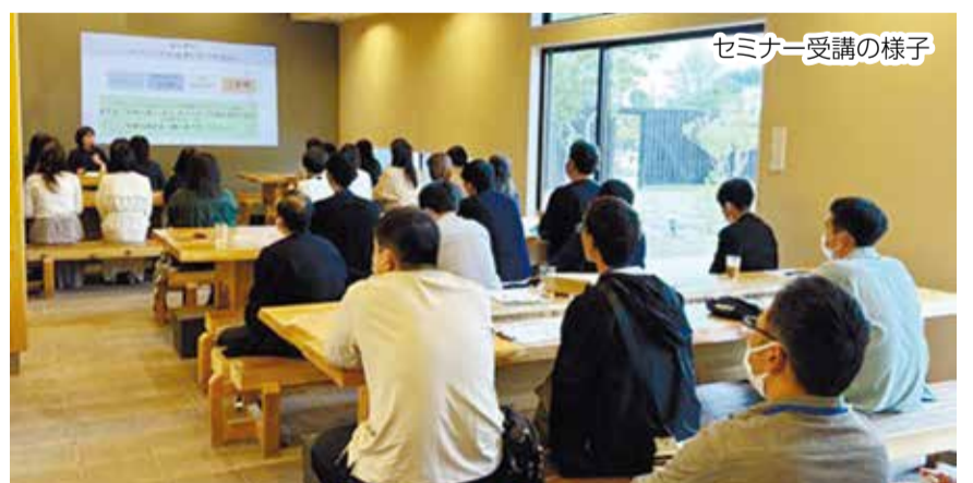
セミナー受講の様子

今回もたくさんのカップルが誕生しました。1組でも多く幸せなお付き合いに繋がるように、私たちもフォローを続けていきたいと思えます。