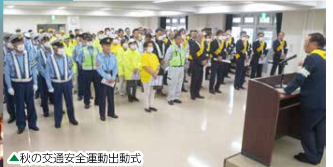
▲秋の交通安全運動出動式