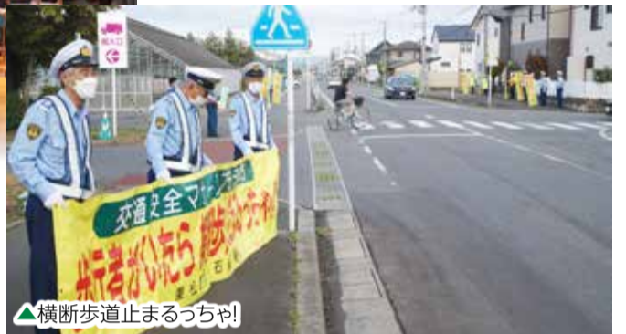
▲横断歩道止まるっちゃん!