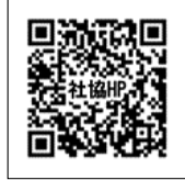
いきいき百歳体操動画

希望する方はサークル代表者・会長、または直接、社会福祉協議会に申し込みください。また、「いきいき百歳体操」を知りたいという方や自宅で運動したいという方向けに、「いきいき百歳体操」動画を東松島市社会福祉協議会ホームページで公開していますので、ぜひ活用ください。