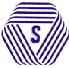
厚生労働大臣認可

厚生労働大臣認可の約款に従って営業することを登録した、「理容店」、「美容店」、「クリーニング店」、「めん類飲食店」では、店頭にSマークを掲げています。登録店は、安心・安全・衛生を約束する信頼できるお店です。