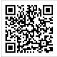
【宮城県ホームページ】