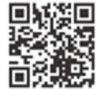
厚生労働省 ホームページ

マイナンバーカードはこちらのポスターやステッカーを貼っている医療機関・薬局でご利用可能です!