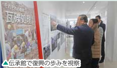
▲伝承館で復興の歩みを視察