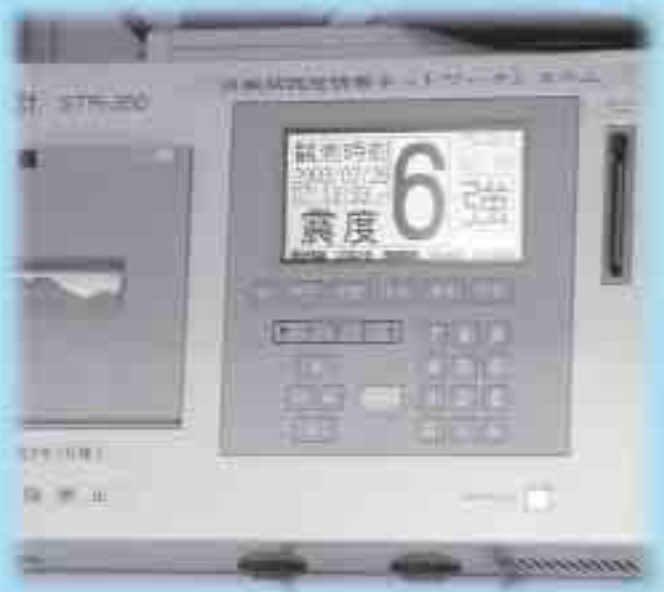
▲ 役場の震度計が「6強」を示しています (平成15年7月26日午前7時13分)

私たちの街をはじめ、近隣市町に甚大な被害をもたらした平成15年7月26日発生 of 宮城県北部連続地震から、間もなく2年が経過しようとしています。そのような中、昨年発生した「新潟県中越地震」や「スマトラ沖大地震」、今年の「福岡県西方沖地震」など、日本や世界各地でも大きな地震や津波が発生。そのたびに多くの犠牲者が出ています。