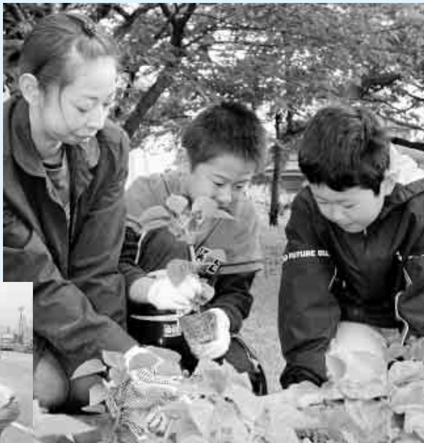
▲丁寧に植えなきゃね(サルビアの植栽/矢本運動公園)