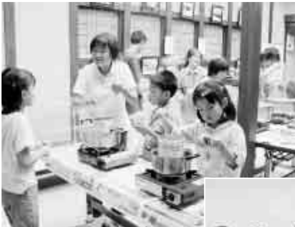
▲ 綺麗にできたかな？ くらっば蔵部 ファンタスティック キャンドル作り (9月12日/交流館)