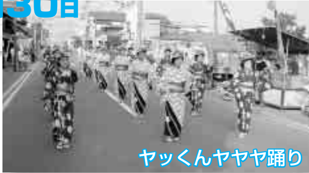
ヤックンヤヤヤ踊り