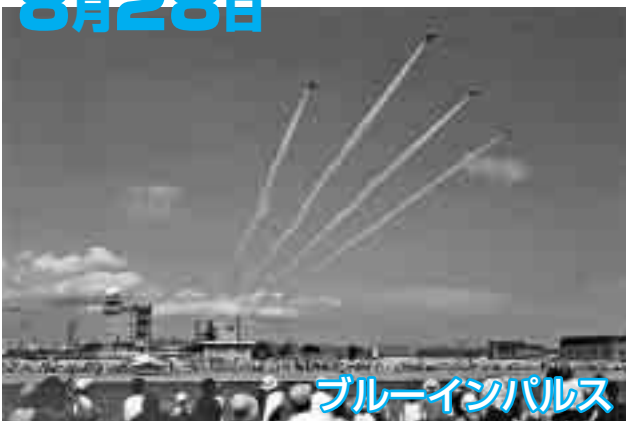
ブルーインパルス