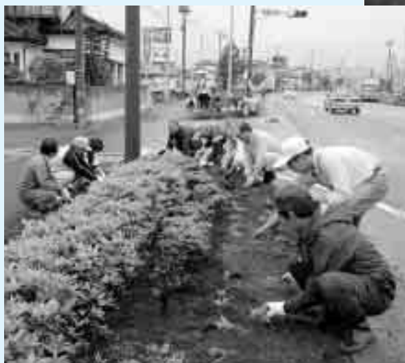
▲早朝から、多くの皆さんが参加くださいました (マリーゴールドの植栽/小野駅周辺)