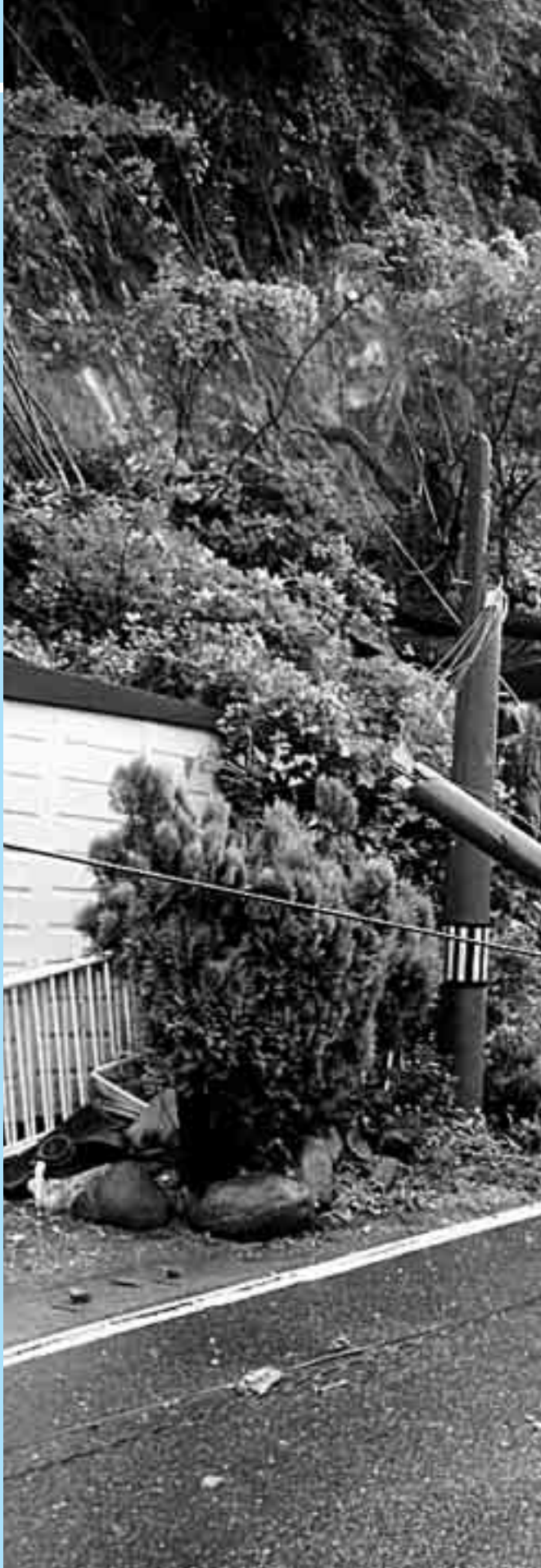
▲ 土砂崩れ現場(新町)、大岩が木・電信柱をなぎ倒しました

日本海溝寄りの海域で発生する地震も想定され、宮城県沖地震がこの海溝寄りで発生する地震と連動すれば、M8.0前後の巨大地震になると予想されています。 再来が予想される宮城県沖地震について、単独型・連動型などのタイプ別に県がまとめた「第3次地震被害想定調査」結果によると、単独型・連動型ともに県内のほとんどの地域で震度6弱以上の揺れになると予測。冬の午後6時に発生した場合の死者は、単独型で96人、連動型で164人と算出し、死者28人だった1978年の地震よりも、はるかに大きな被害を予想しています。