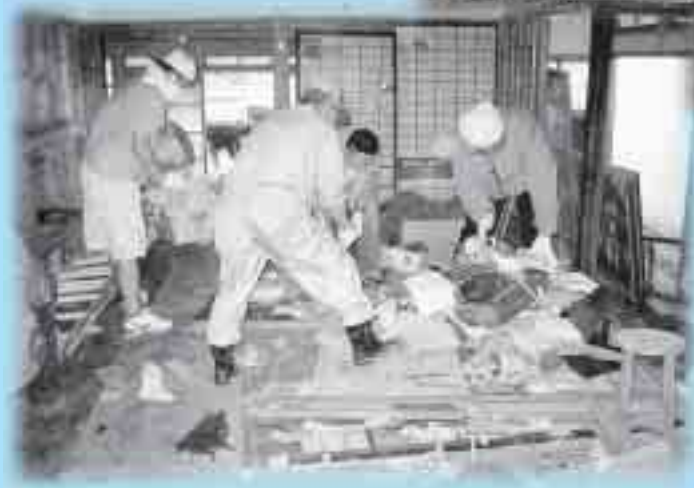
▲ 多くのボランティアの方々のご尽力くださいました