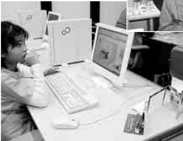
▼ 小学生もたくさん施設を訪れ、 インターネットを楽しんでいます (情報プラザ)