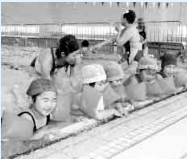
▲バタ足バタバタ、みんな上手にできるかな