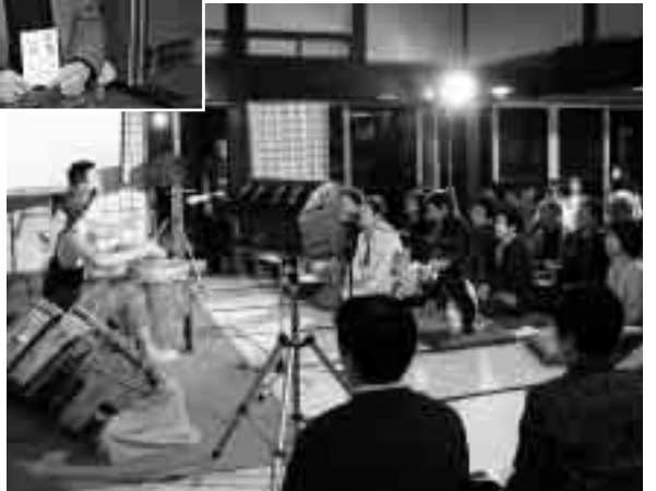
▼ 心に響くような異国の音楽、会場は熱気に包まれました アフリカの風、大地の香り。スライドショーとライブ (10月16日/交流館)