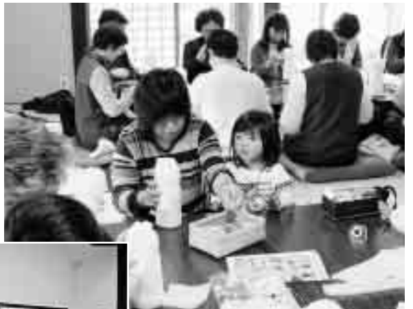
▲ 可愛く作るの難しいね～ くらっば蔵部 スノーマン作り (11月12日/交流館)