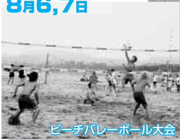
ビーチバレーボール大会