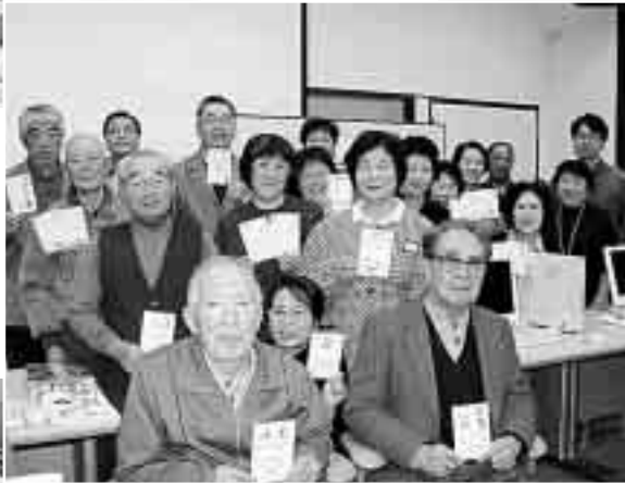
▲ 皆さん、お見事です シニア年賀状作成教室 (11月25日/情報プラザ)