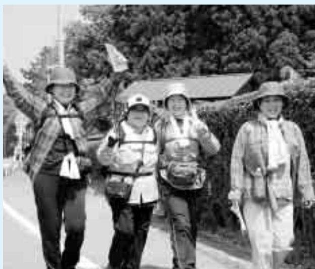
▲青空の下、参加者の皆さんも元気いっぱい

この日は天候にも恵まれ、参加者たちは思い思いのスタイルでウォーキングを楽しみながら、さわやかな汗を流していました。