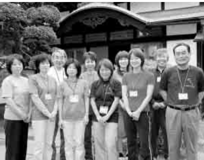
◀ 元気な笑顔で、皆さんのお越しをお待ちしてま〜す

蔵しつつくパークは、管理運営の全てが民間に業務委託された市所有の施設で、現在10人のスタッフで2つの施設の維持管理並びに事業を計画し