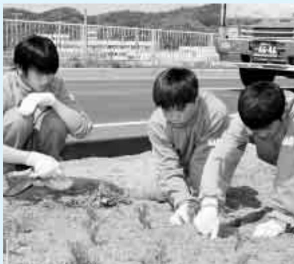
▲私たちの街を、花いっぱいしよう (鳴瀬一中マリーゴールドの植栽/鳴瀬大橋周辺)