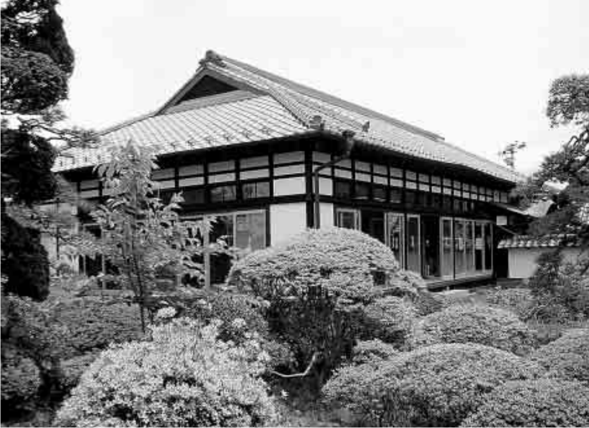
▲蔵しっくパーク「矢本ひと・まち交流館」外観

各施設の事業実施については、ふれ愛情報プラザの各種教室では21人のパソコンボランティアの方々が、参加者への指導補助を担当。また、ひと・まち交流館では8人の蔵つば応援団の方々が、各種事業のサポートを、そして、くらっば蔵部の実施に当たっても多くの先生方にご協力いただいています。 このように、蔵しっくパークは、利用者はもちろん多くの方々に支えられ、2年目を迎えています。