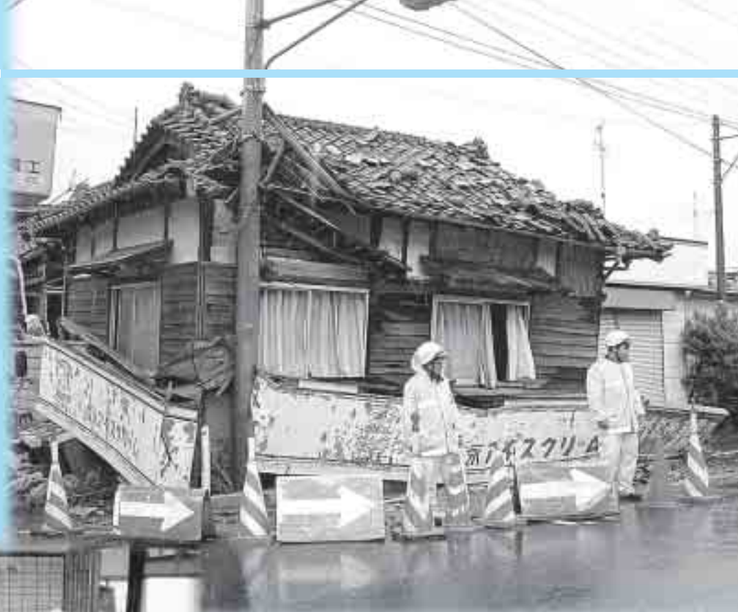
▲ 家屋の倒壊現場(下町一)、1階部分が押しつぶされています