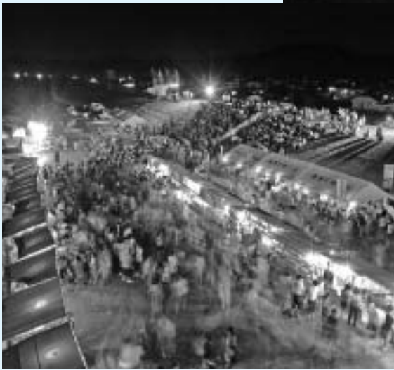
▲ 会場は多くの人々にぎわいました