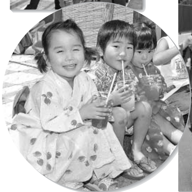
▲ 暑い日はカキ氷に限るよね～