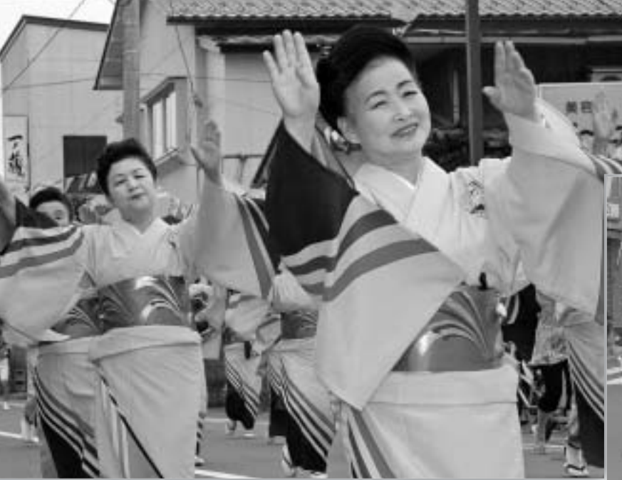
▲ 着物に音頭、日本の夏は踊りの夏