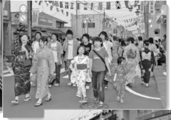
▼ 屋台が立ち並ぶメインストリートに約3万人が訪れました