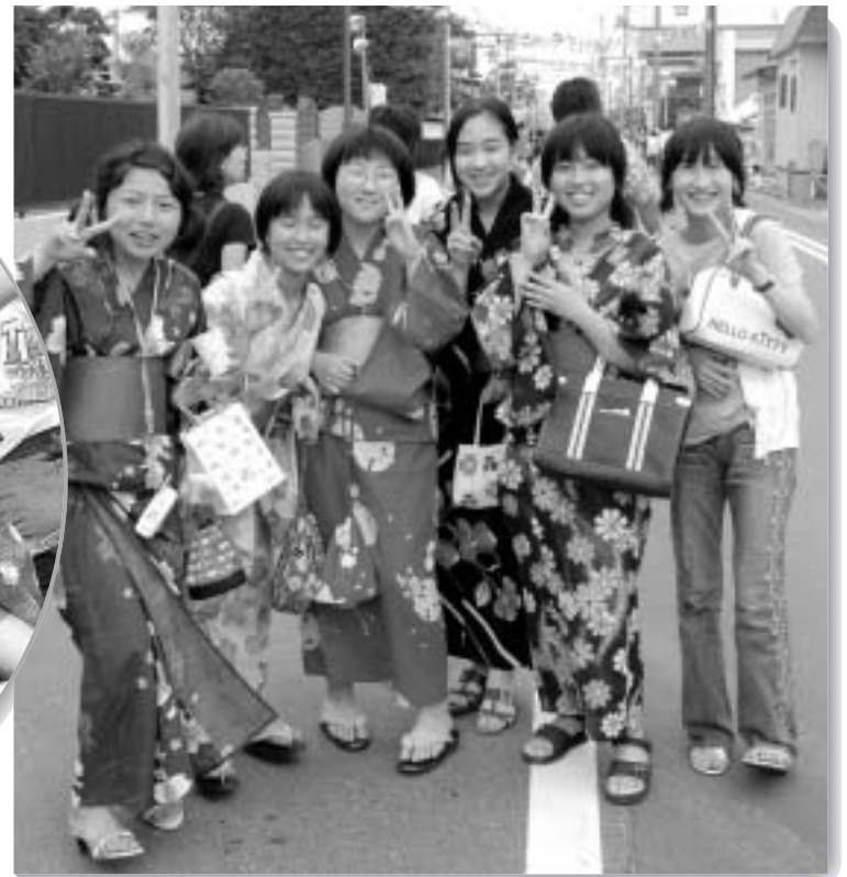
▲ 夏はやっぱり浴衣でしょ～