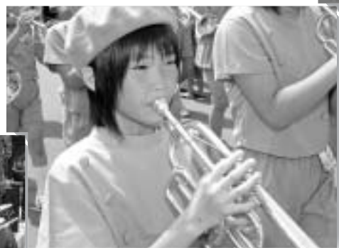
▲ 強い日差しの中、音楽パレード行進中