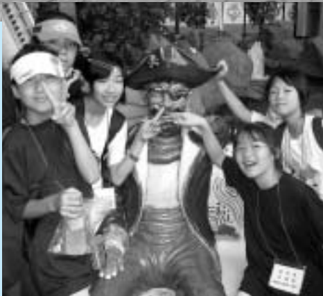
▲ロッテワールドで大はしゃぎ

7月25日から29日にかけて行われた大林初等学校との相互交流事業(東松島市主催、東松島日韓友好協会主管)も、今年で13年目を迎えました。今回の交流は、昨年旧矢本町においてホームステイ(受入)交流をした小中学生15人が韓国ソウル市を訪問。大林初等学校の児童と喜びの再会を果たしました。