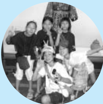
▲すっかり仲よし(民俗資料館)