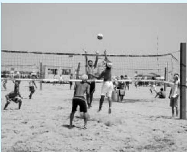
▲目を見張るようなプレーが続出しました

ビーチで熱戦を楽しむ海水浴客も多く、コートでプレーする選手は、声援を力に変えてボールを追っていました。