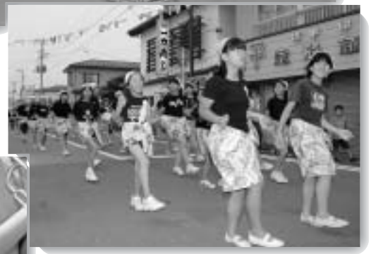
▲ ヤックンサンバのリズムにのって 軽快なステップ