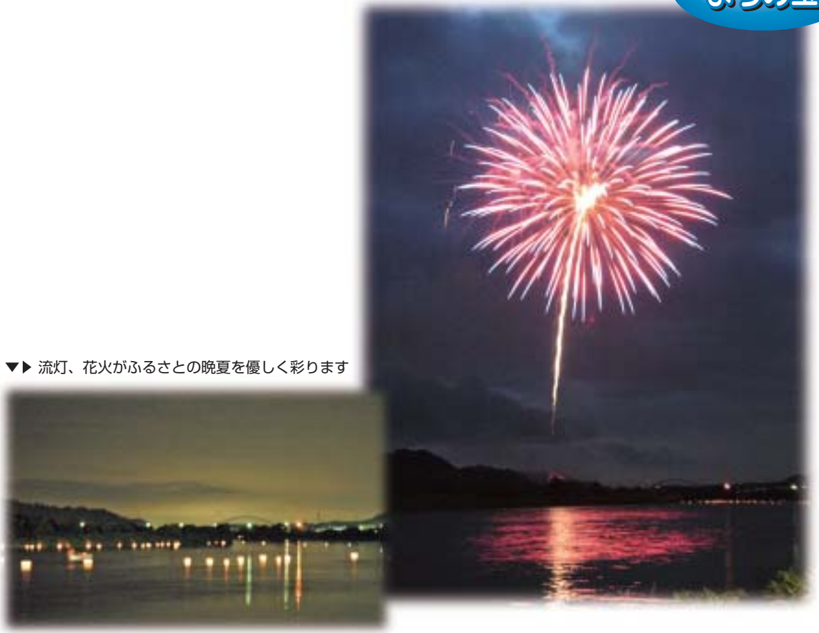
▼▶ 流灯、花火がふるさとの晩夏を優しく彩ります