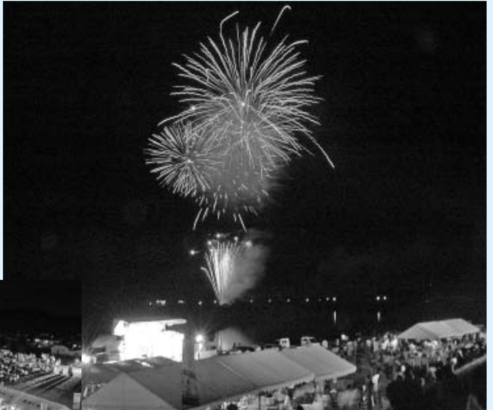
▲ 祭のフィナーレ、スターマイン