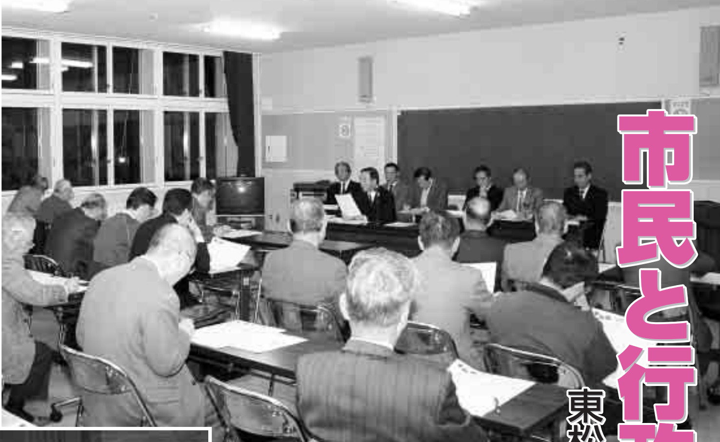
▲参加者から、活発な意見が出されました(赤井地区)

今回出された質問や提言に対しては、市長を中心とする市執行部側がその場で応え、それぞれに急を要するものや必要不可欠なものについては優先的に対応すると回答。また、予算が伴うものについては今年度の補正予算や平成18年度の当初予算に計上し、そのほか大規模なものについては現在策定中の東松島市長期総合計画に盛り込み、計画的に取り組みと説明しました。