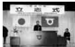
▲ 昨年開催された立志式の様子(旧瀨瀬町)