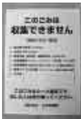
違反者はイエローカード!