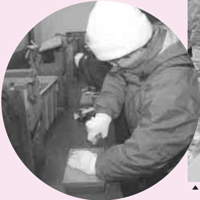
▲参加者らがカキむきの作業を実際に体験