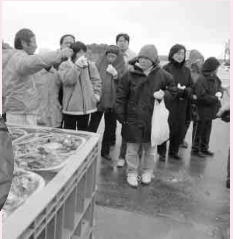
▲共同かき処理場で施設などの説明を受ける参加者