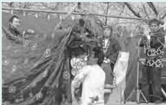
▲健やかな成長を祈ってガブリ