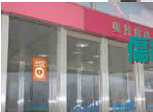
▲AEDが設置してある施設は入口にステッカーが貼ってあります