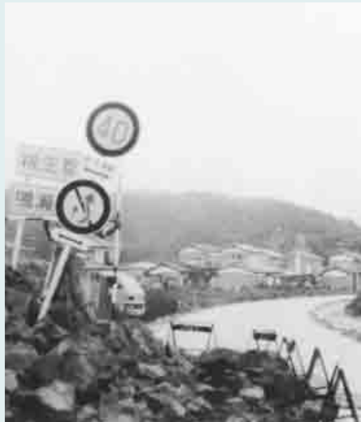
▼宮城県沖地震(昭和53年)での被害写真(大塚地区)