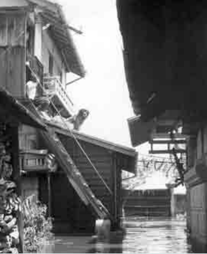
▲チリ津波(昭和35年)の被害写真。屋根の上に人と犬が乗っています(東名地区)