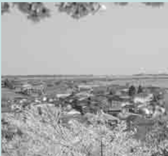
▲遠くふるさとを思い…(小野地区のお館山から見た風景)

今回の総会には東松島市から阿部秀保市長、三浦昇市議会議長を始めとして来賓も多く出