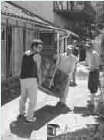
▶▶ボランティアによる復旧作業が活発に行われました(北部連続地震)

これは、普段からのコミュニケーションが実を結んだものであり、地域で人を救った良い例だといえます。いざというとき、こうした例を増やすことができるよう、積極的に各地区の自主防災組織に参加しましょう。