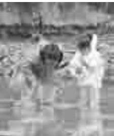
▲「お姉ちゃん、これアサリ？」 (宮戸島波津々浦の潮干狩り)