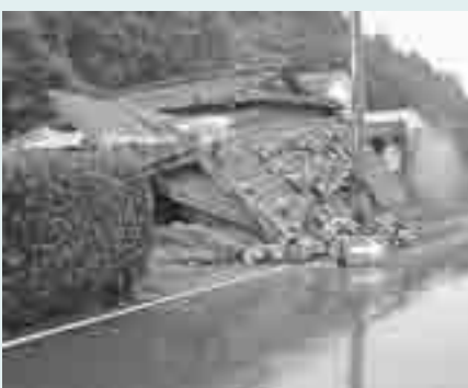
▶北部連続地震で倒壊した家屋(天塩地区)

にそういったことを想定した常日頃からの準備の重要性を知ったはず。幸いにも、死亡者の出なかつた旧両町。これらの経験を活かして災害をできるだけ防ぐようにしたいものです。