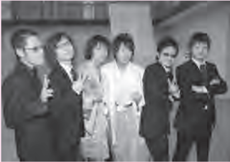
▲俺たちもこれから大人です、よろしく