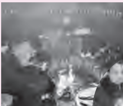
▲岩屋での生活の様子 「煙が目にしみる～」