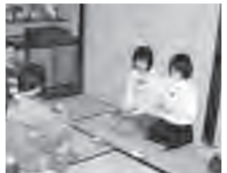
▲初めての正座で「足が痛い…」