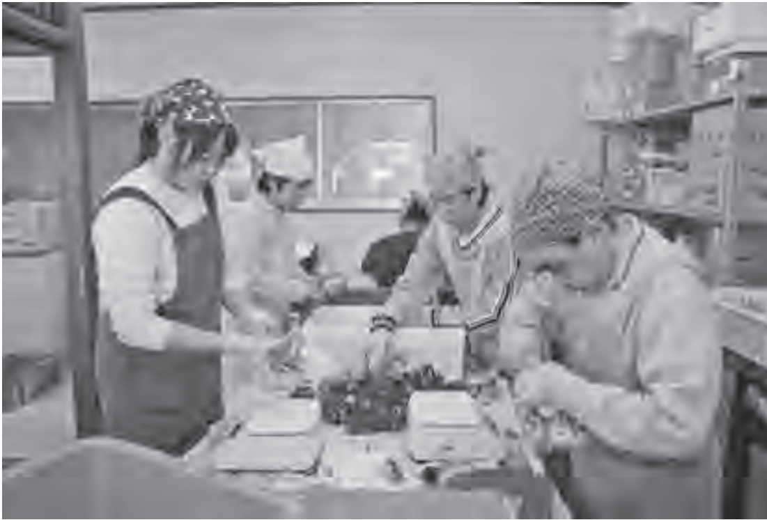
▲生きがいある生活づくりをお手伝いします

市は、日中一時支援事業をシリーズで紹介するこのページ。今回は、日中一時支援事業についてお知らせします。