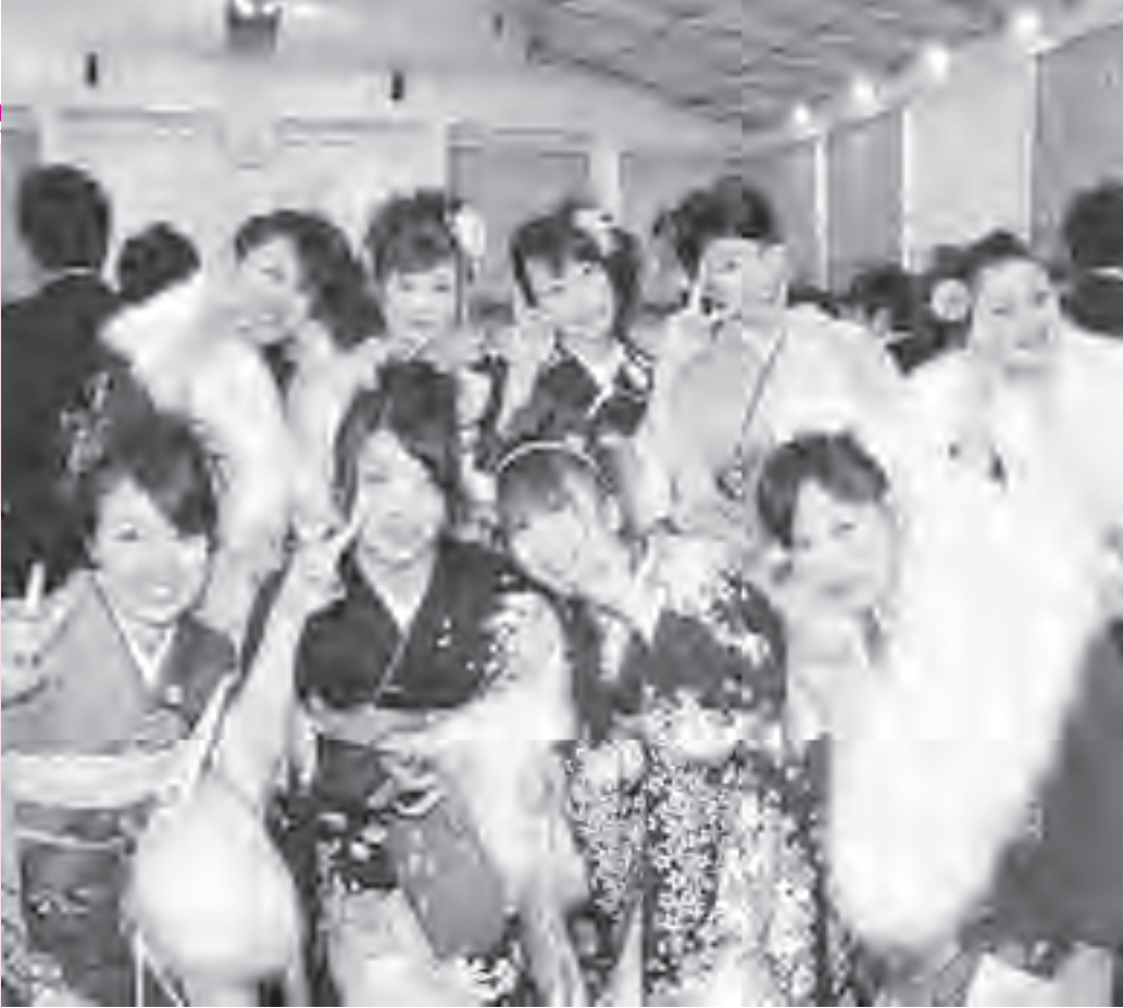
▲久しぶりの友だちと笑顔の一枚