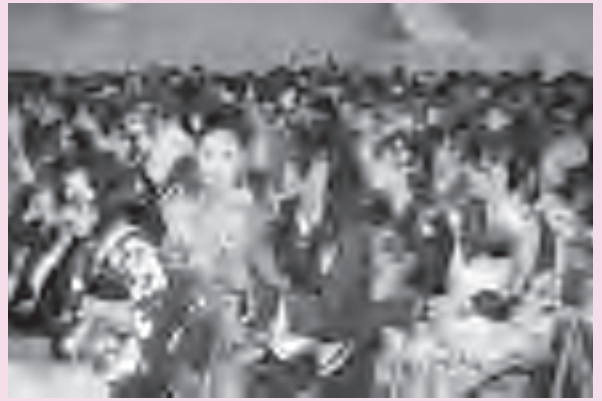
▲あでやかな振袖姿が式に華をそえます