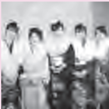
◀ 私たちも大人の仲間入り