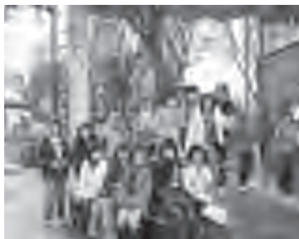
▲仙台市で自由行動♪