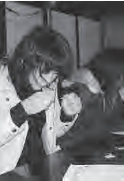
▲ビーズストラップを作っている様子「むずかし〜」

最終日の1月8日、市コミユニティセンターでお別れ式が行われた後、参加した生徒たちは仙台空港へと向いました。当初、市コミユニティセンターで見送る予定だったホストファミリーも同行。飛行機への搭乗時間が近づくと、涙を流しながら再会を誓っていました。