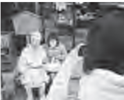
▲芭蕉と一緒に「ハイキムチ」