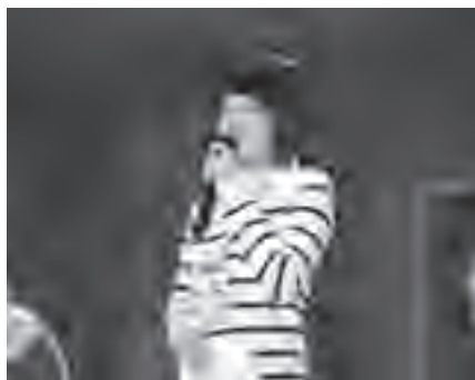
▲お久しぶりです。再会を楽しみにしてきました