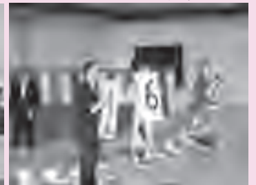
▼市長から「自由」と「権利」の言葉が贈られました