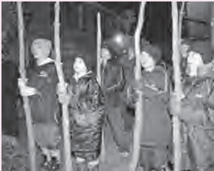
▲「井戸は良い水沸くように」。家々にちなんだ願いを唱えます(鳥追いの様子)

どもたちが地区内の家々をまわり、1年間の豊作や豊漁、無病息災などを祈願するもので、このとき「えんずのわりとうりょうば(意地の悪い鳥を)…」と、独特の唱え歌を身の丈より長い棒で地面をつきながらうたいます。