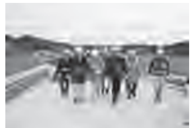
▲現場説明会の様子