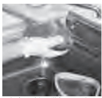
▲生ごみの水切りは徹底してください