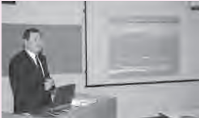
▲県の担当者がDCについて説明

同協議会では当面の目標として今年10月から3カ月間実施されるプレDCに向けて、市をPRするための企画商品、地場産品などを検討していきます。