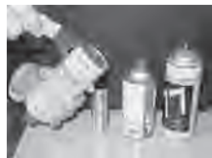
▲スプレー缶を出す際は必ず穴を開けましょう！

ガスが残っているスプレー缶やボンベを、空き缶の圧縮機に入れてしまうと、機械の中で爆発して火が出てしまうので大変危険です。