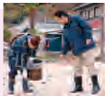
▲月浜でのワンシーン