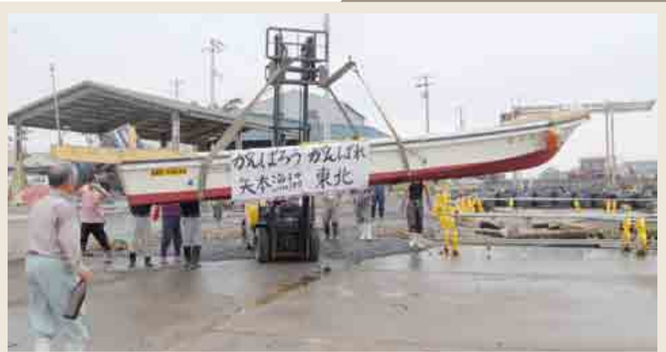
▲県漁協矢本支所に、熊本県のノリ養殖漁業者仲間から1.2トンの船外機船が届けられました(9月15日、大曲浜漁港)