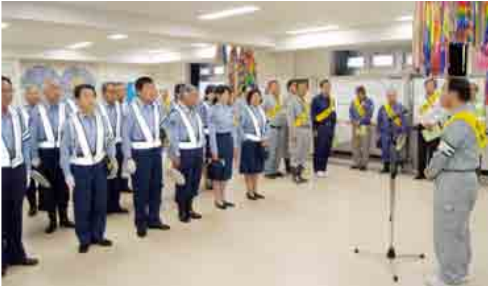
▲平成23年秋の交通安全運動出動式が行われ、交通事故防止へ決意を新たにしました(9月21日、市役所)