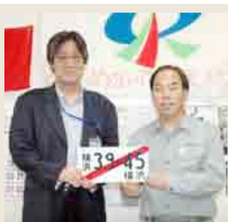
▲横浜市から大型バス(42人乗り)1台が寄贈されました(9月20日)

▲市コミュニティセンターは10月1日から貸館業務(ホール除く)を再開し、初日はBRONZE道心がライブを行いました(市コミュニティセンター中央広場)