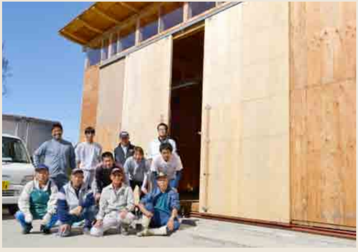
▲漁業者の作業小屋や集会所となる「番屋」が浜市地区に完成。建設には宮城大学の学生や生産者が手がけ、浜市小学校の児童が壁紙の色付けで協力しており、新しい地区の拠点が生じました(10月1日)