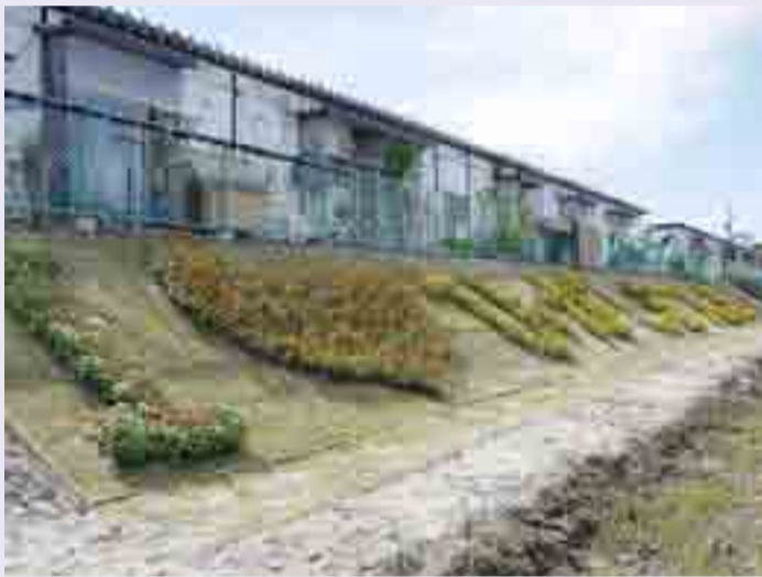
▲大塩グリーンタウン仮設住宅敷地内に、ボランティアと入居者有志が協働作業で「I♥ひがしまつしま」の花壇を植栽しました(9月23・24日)