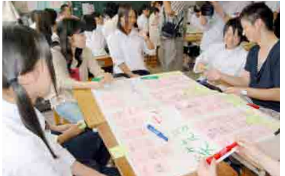
▲中学生の視点で復興まちづくりを考えるワークショップが鳴瀬第二中学校で開かれ、3年生が将来像を語り合いました(9月20日)