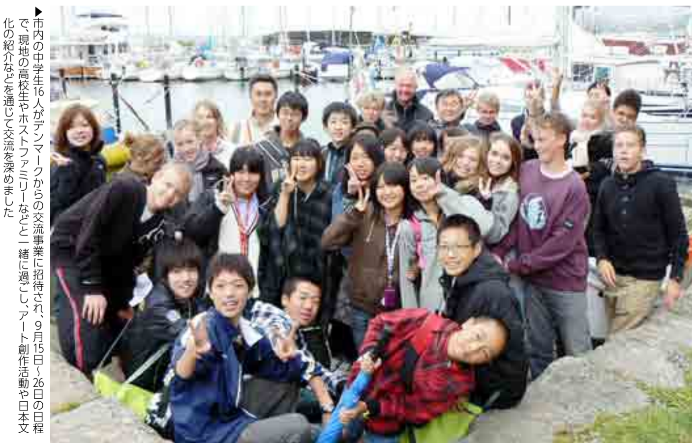
▶市内の中学生16人がデンマークからの交流事業に招待され、9月15日〜26日の日程で、現地の高校生やホストファミリーと一緒に過ごし、アート創作活動や日本文化の紹介などを通じて交流を深めました