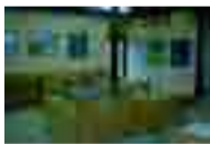
展示室・通り庭1と2