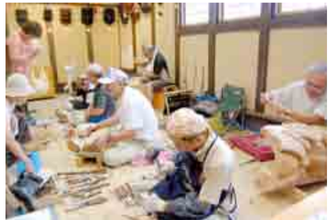
▲加美町文化協会「木彫りの会」主催の「釜神展」が開かれ、火除け魔除けの護り神「釜神様」の現代版新作が展示され、彫り方の実演も行われました(9月12日、蔵しっくパーク)

▶震災復興支援の一環として被災地の小学校を訪問する「ふれあいサッカーキャラバン」が訪れ、地元の小学生たちがプロの選手たちとサッカーを楽しみました(9月18日、小野小学校)