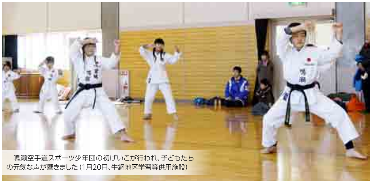
鳴瀬空手道スポーツ少年団の初げいごが行われ、子どもたちの元気な声が響きました(1月20日、牛網地区学習等供用施設)