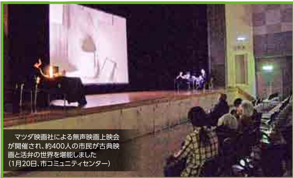
マツダ映画社による無声映画上映会が開催され、約400人の市民が古典映画と活弁の世界を堪能しました(1月20日、市コミュニティセンター)