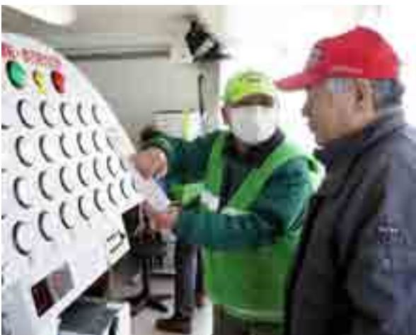
▲安全教育のための教育機器を備えた、宮城県警の交通安全教育車が矢本運動公園仮設住宅を訪れ、適性診断などで入居者の交通安全意識の高揚を図りました(1月30日)

小野寺五典防衛大臣が東松島市を訪れ、市役所で意見交換を行った後、航空自衛隊松島基地を視察しました(1月22日)