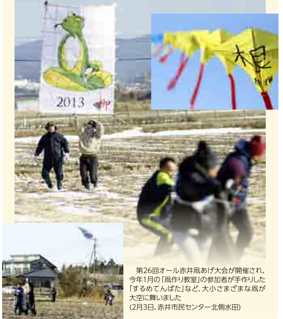
第26回オール赤井凧あげ大会が開催され、今年1月の「凧作り教室」の参加者が手作りした「するめてんばた」など、大小さまざまな凧が大空に舞いました(2月3日、赤井市民センター北側水田)