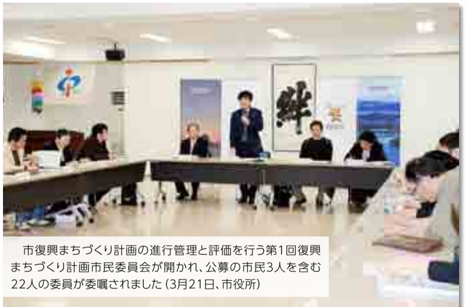
市復興まちづくり計画の進行管理と評価を行う第1回復興まちづくり計画市民委員会が開かれ、公募の市民3人を含む22人の委員が委嘱されました(3月21日、市役所)