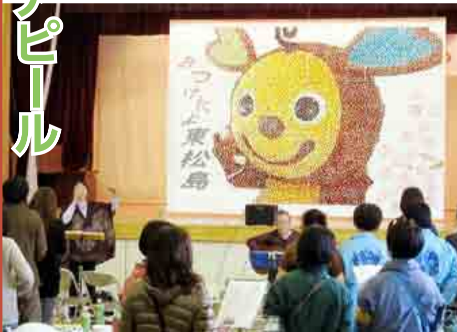
全国の支援に「ありがとう」の気持ちを伝える復興感謝祭が開かれ、まちの元気をアピールしました。モザイクアートでは、市キャラクター イートを表現しました (3月23日、小野市民センター)