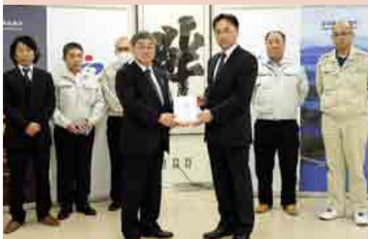
県建設業協会石巻支部青年会から本市に防犯ブザー370個が贈られました。市内の小学1年生が使用し、登下校の安全に役立てます(3月19日、市役所)