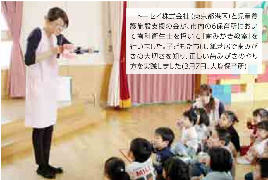
トーセイ株式会社(東京都港区)と児童養護施設支援の会が、市内の6保育所において歯科衛生士を招いて「歯みがき教室」を行いました。子どもたちは、紙芝居で歯みがきの大切さを知り、正しい歯みがきのやり方を実践しました(3月7日、大塩保育所)