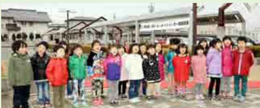
三井物産株式会社=本社:東京都千代田区=が設置した、東松島「絆」カーポートソーラー(カーポート型太陽光発電設備)が市コミュニティセンター・鷹来の森運動公園・大塩市民センターの3か所の敷地内に完成し、完成記念式典が開かれました。式典では子どもたちが完成を祝いました(3月13日、市コミュニティセンター前駐車場)