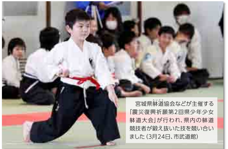
宮城県剣道協会などが主催する「震災復興祈願第2回県少年少女剣道大会」が行われ、県内の剣道競技者が鍛え抜いた技を競い合いました (3月24日、市武道館)