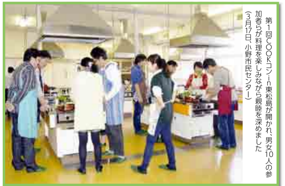
第1回COOKコンソーシアム東松島が開かれ、男女10人の参加者が料理を楽しみながら親睦を深めました (3月17日、小野市民センター)