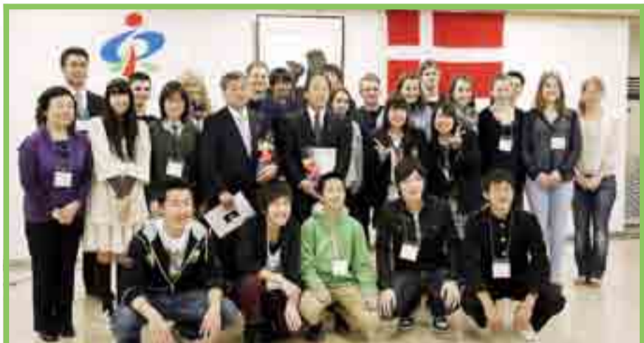
震災直後から東松島市への支援を続けるデンマーク王国から、8人の高校生が本市を訪れ、6日間滞在しました。デンマーク王国中学生交流事業に参加した本市の中高生が、デンマークの高校生をもてなし、海を越えた友情をさらに強く育みました(3月22日、市役所)