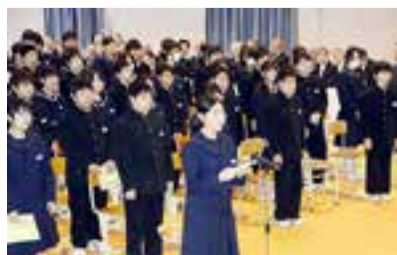
▲開校式の様子(4月8日)

鳴瀬第一中学校近くの川と鳴瀬第二中学校近くの海を描き、両校の校章にあった「知」を表すパンの図柄を取り入れました。また、鳴瀬未来中学校の名から未来の星を育てる学校という意味を込めて周りに星を配しています。