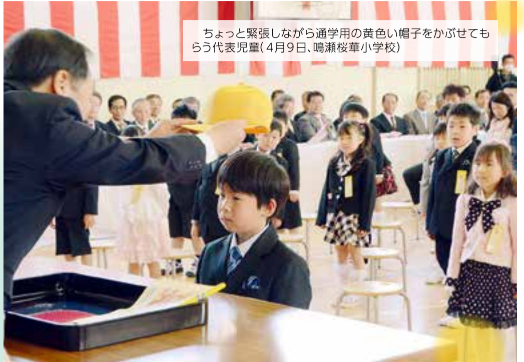
ちょっと緊張しながら通学用の黄色い帽子をかぶせてもらう代表児童(4月9日、鳴瀬桜華小学校)