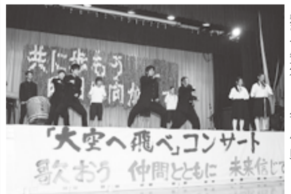
▲大空へ飛べコンサートに鳴瀬中心援団 飛び入り参加(2012年8月5日)