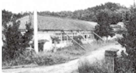
▲西福田分校(現在の西福田下集会所付近)