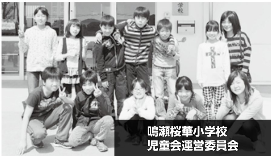
鳴瀬桜華小学校 児童会運営委員会

統合初年度にあたり、児童同士の関係や震災後の心のケアに配慮し、地域に誇れる学校を目指しますので、今後とも保護者の皆さまのご理解とご協力をお願いします。