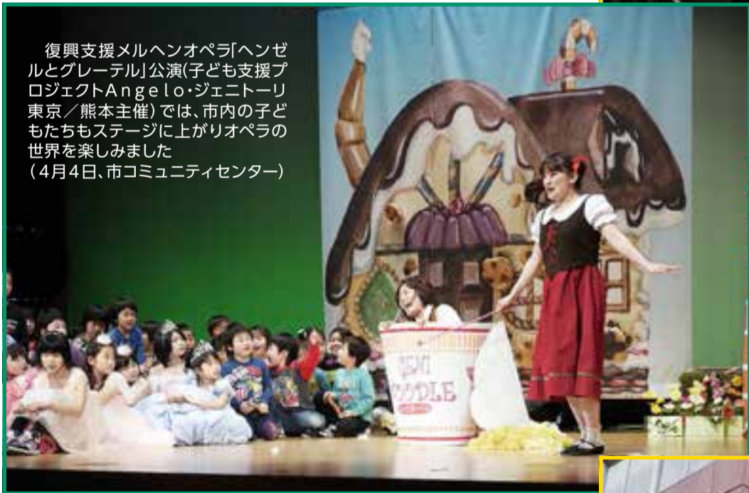
復興支援メルヘンオペラ「ヘンゼルとグレーテル」公演(子ども支援プロジェクトAngelo・ジェネーリ東京/熊本主催)では、市内の子どもたちもステージに上がりオペラの世界を楽しみました(4月4日、市コミュニティセンター)