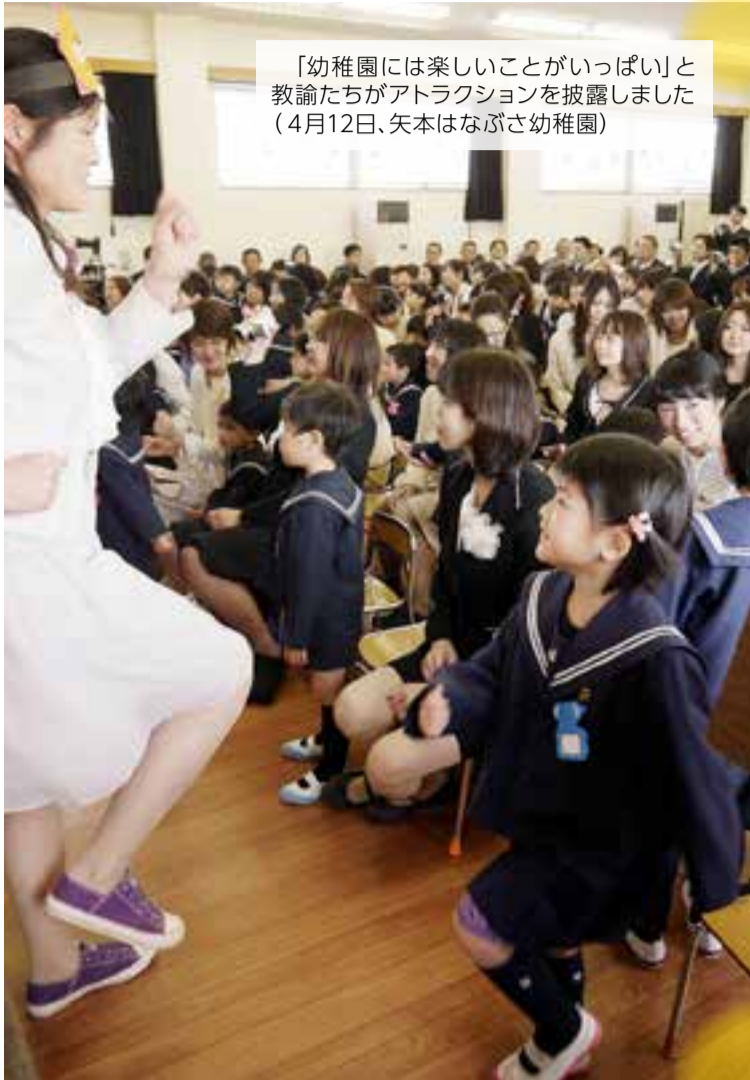
「幼稚園には楽しいことがいっぱい」と教諭たちがアトラクションを披露しました(4月12日、矢本はなびさ幼稚園)