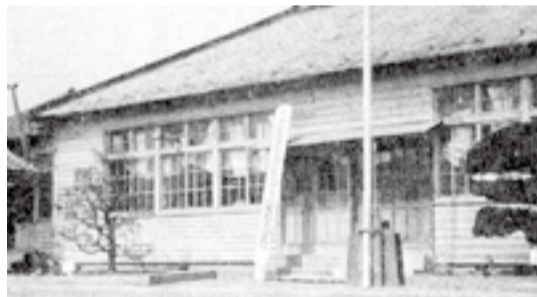
▲川下分校(現在の農村創作活動センター敷地内(上下堤地内))