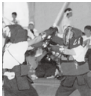
▲平成11年度全校剣道大会の様子