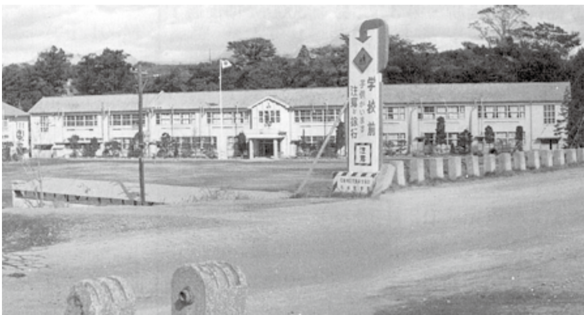
▲旧校舎全景(昭和44年ごろ)