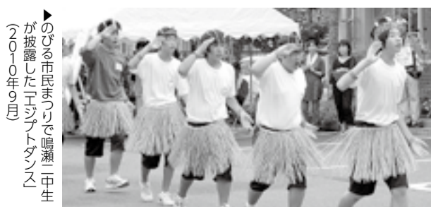
▲のびる市民まつりで鳴瀬一中生が披露したエシブダンス(2010年9月)