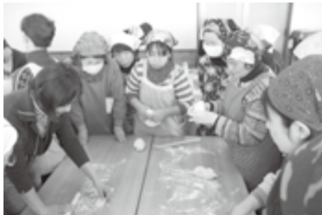
好評だった「皮から作る手作りギョーザ」

福祉部会では、春には地域の農家の方を講師に梅干しづくりをしたり、夏休みには流しそうめんをしたりと、地元の特徴を生かしながら食を通じた地域コミュニティの醸成に努めています。みんなで同じ作業に取り組むことで連帯感が生まれますし、特に今回は若い人が多く参加してくれて頼もしく感じました。今後も住みよいまちづくりを目指し、事業を推進していきたいです。