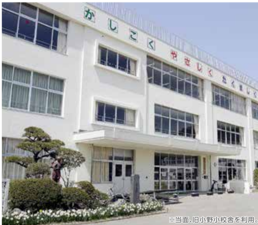
※当面、旧小野小校舎を利用。

鳴瀬桜華小学校校歌「花になろう」 作詞/松井五郎 作曲/中村雅俊 編曲/大塚修司 春には桜の坂道を 駈け上がれば見える空 夏には鳴瀬川のせせらぎと 響きあう声 蒼く(蒼く) 萌える(萌える) 風に絆を育んで 心と心が 夢でつなげるように 明日へ咲かせる花になろう 秋には色づくケヤキの葉 優しく季節を染める 冬には雪の音を紡いで 灯した明かり どんな(どんな) ときも(ときも) 強い絆に結ばれて 心と心が 愛を奏でるように 明日へ咲かせる 花になろう ラララ・・・ ラララ・・・ いつも強い いつも優しい 花になろう なろう 誰かのために いられるような 桜の華に なろう