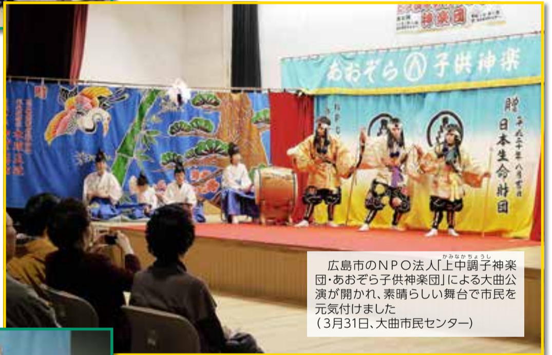
広島市のNPO法人「 かみなかちょうし 上中調子神楽団・あおぞら子供神楽団」による大曲公演が開かれ、素晴らしい舞台上で市民を元気付けました(3月31日、大曲市民センター)