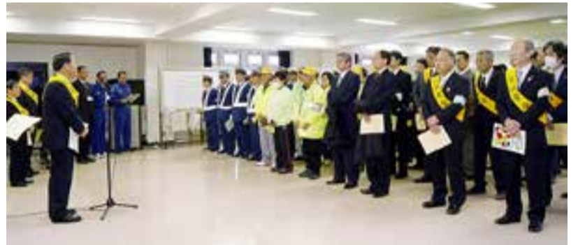
平成25年春の交通安全出動式が行われました。交通安全日本一を目指して地域一丸となって連携していくことを改めて確認し、式の終了後には市内各JR駅前などでマナーアップ作戦を展開しました(4月8日、市役所)