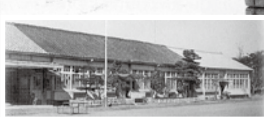
▲旧校舎全景(昭和39年ごろ)