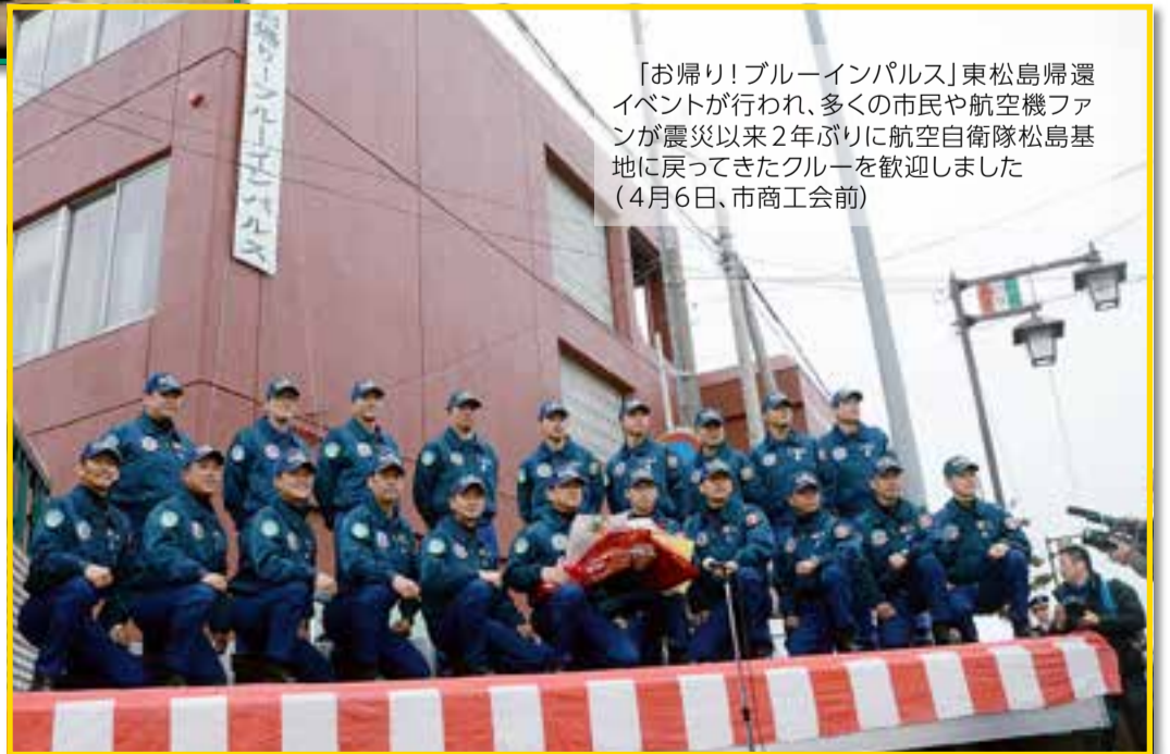
「お帰り!ブルーインパルス」東松島帰還イベントが行われ、多くの市民や航空機ファンが震災以来2年ぶりに航空自衛隊松島基地に戻ってきたクルーを歓迎しました(4月6日、市商工会前)