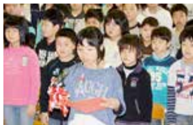
▲開校式の様子(4月8日)

校名にある桜の花びらを表すとともに、小野小学校の校章にある鳴瀬川と吉田川を表す2本のラインと浜市小学校の校章にある太平洋の波をデザインしました。海・山・川がある豊かな環境の中で両校の伝統を受け継ぎ、協力し合って、新しい学校を盛り上げていきたいという思いを込めています。