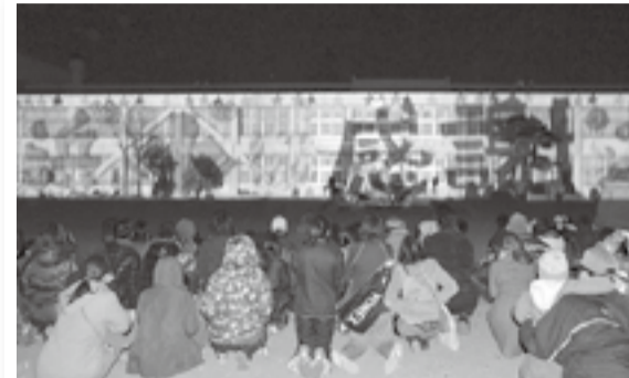
▲浜市小学校感謝祭の様子。校舎にプロジェクターで投影(プロジェクションマッピング)された感謝のことが多くの来場者に感動を与えました(3月23日)