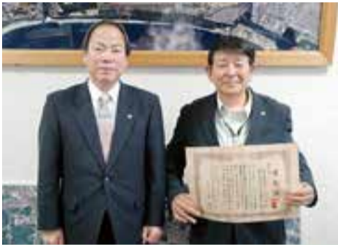
グリーン・ツーリズム商品(グリーン旅)コンテスト2012<主催:都市と農山漁村の共生・対流推進会議(オーライ!ニッポン会議)>の公開オーディションが、3月27日に東京都渋谷区・こどもの城で行われ、本市の奥松島体験ネットワークがエントリーし、優秀賞を受賞しました。同コンテストにおける宮城県内の団体などの受賞は初めてで、今後 グリーン・ツーリズムや観光に関わる関係者や旅行会社などとの提携が見込まれ、東松島の観光復興の原動力として大きく期待できるものです