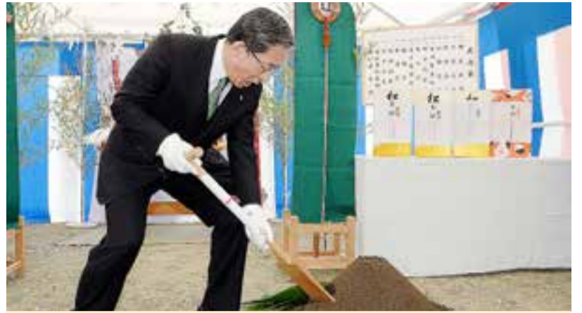
市が県に委託して整備する災害公営住宅の起工式が、小野地区の鳴瀬学校給食センター跡地で行われました。1棟21戸の共同住宅で、平成26年4月の入居開始を予定しています(4月2日)