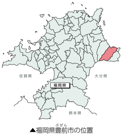
▲福岡県豊前市の位置

豊前市は、福岡県の東南端に位置し、南に修験道の遺跡で知られる国指定史跡「求菩提山」をひかえ、扇状に広がる豊前平野と波静かな周防灘に面しています。人口は2万7千516人(平成25年2月現在)。マスコットキャラクターの「くぼてん」は求菩提山に伝わるカラス天狗をイメージしています。 主要な交通網としては、JR日豊本線や平成27年3月に開通予定の東九州自動車道があり、北九州空港を利用すれば東京から3時間程の距離です。 また、古くから伝わる「豊前市の岩戸神楽」(県指定)は現在、 豊前市は、福岡県の東南端に位置し、南に修験道の遺跡で知られる国指定史跡「求菩提山」をひかえ、扇状に広がる豊前平野と波静かな周防灘に面しています。人口は2万7千516人(平成25年2月現在)。マスコットキャラクターの「くぼてん」は求菩提山に伝わるカラス天狗をイメージしています。 また、山間部の棚田で作られる「棚田ゆず」は柚子胡椒やかるかん饅頭など多くの特産品を生んでいます。ぜひ一度お越しください。 (文:豊前市総合政策課広報担当)