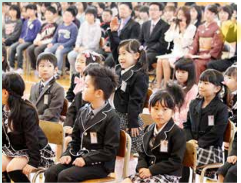
▲名前を呼ばれ、元気に「はいっ!」。たくさんの人の前で立派に返事をしました(4月9日、赤井南小学校)