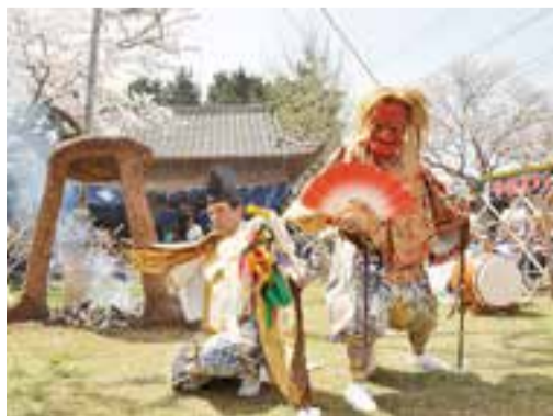
▲豊前市の岩戸神楽(県指定)