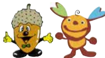
更別村キャラクター どんちゃん