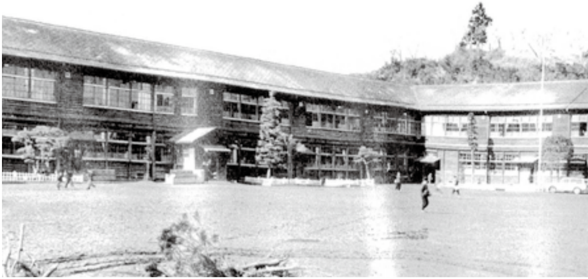
▼旧校舎全景(昭和32年ごろ)