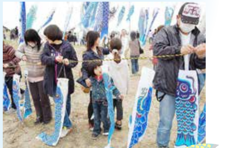
▲全国から寄せられた鯉のぼりを丁寧に取り付けました