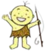
奥松島縄文村のキャラクター げんちゃん