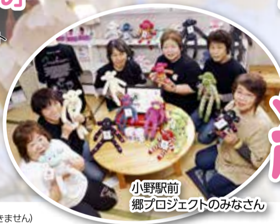
小野駅前郷プロジェクトのみなさん

「おのくん」フェイスブック http://ja-jp.facebook.com/onokunpages