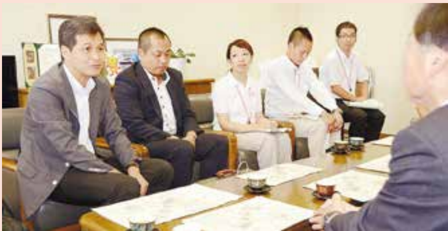
熊本市の幸山政史市長(写真左)が東松島市を訪れ、阿部秀保市長と復興の進捗などについて懇談しました。熊本市から派遣されている職員も同席し、両市長から激励と感謝の言葉を受け取りました(8月21日、市役所)