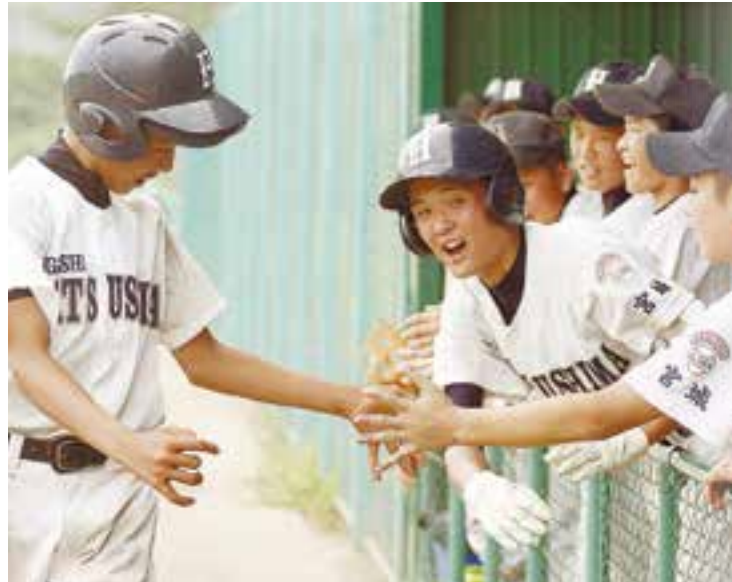
第4回楽天イーグルス石巻地方支援交流協議会長杯争奪リトルシニア大会が行われました。東松島市で活動する中学生硬式野球チームの東松島リトルシニアが出場し、全力のプレーに大きな拍手が送られました(8月18日、鷹来の森運動公園)