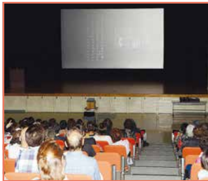
平成24年3月に東京都の銀座で行った市民ミュージカル「とびだす100通りのありがとう」のDVD上映会が開かれ、約200人が感動の舞台を鑑賞しました。2時間の上映終了後、ミュージカル出演者が銀座での公演と同じように来場者を盛大に見送りました(8月25日、市コミュニティセンター)