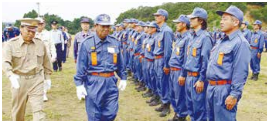
平成25年度東松島市消防演習が行われ、消防団員・婦人防火クラブ員合わせて約400人が参加しました。行進や整列による小隊訓練と積載車操法で競いながら、団員たちは防災、防火に向けて士気を高めていました(8月25日、鷹来の森運動公園)