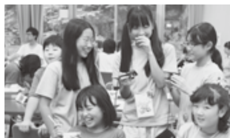
▲交流会では友情を深めました

この交流事業は1年ごとにお互いのまちを開催地としてきましたが、震災後は東松島市の受け入れができませんでした。2年続けて更別村にお世話になりました。ようやく環境が整い、今年は震災後初めて東松島市が開催地になりました。