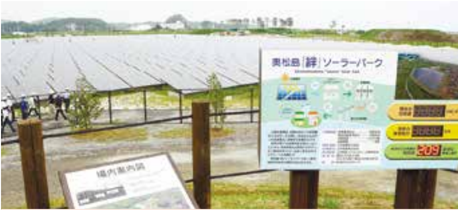
津波で廃止となった奥松島運動公園跡地内に大規模太陽光発電施設「奥松島『絆』ソーラーパーク」が完成し、記念式典が行われました。大手商社の三井物産=本社・東京都千代田区=が市から約4.7ヘクタールを賃借して整備しました。年間発電量は一般家庭約600世帯分に相当する約210万kWhで、電気は電力会社に売電します(8月23日)