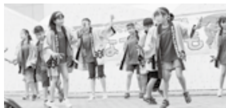
▲「がんばっぺ東松島 みんなで子ども夏まつり」の舞台上でよさこい踊りを披露する更別村の子どもたち

初日は濃霧で飛行機が着陸できず、更別村の児童生徒は新千歳空港周辺で宿泊し、東松島市の児童生徒は大塩市民センターに共同宿泊しました。翌日の歓迎式ではTシャツの交換や4班に分かれて旗を作ったほか、食事