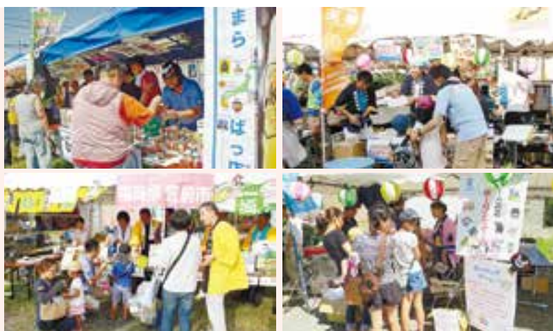
復興支援で他の自治体から長期派遣されている職員有志の皆さんが、昨年に続き今年も「東松島夏まつり2013」に参加しました。北海道北見市と愛媛県松山市、熊本県は合同でご当地限定ジュースや「くまモン」グッズを販売(左上写真)。福岡県豊前市(左下写真)と熊本県天草市(右上写真)はそれぞれの特産品を並べ、また建設課派遣職員チーム(右下写真)は子どもたちのために輪投げゲームなどでイベントを盛り上げました(8月24日)