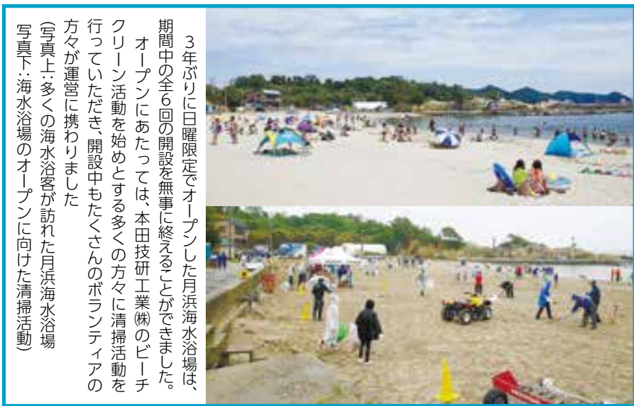
3年ぶりに日曜限定でオープンした月浜海水浴場は、期間中の全6回の開設を無事に終えることができました。オープンにあたっては、本田技研工業(株)のビーチクリーン活動を始める多くのの方々清掃活動を行っていただき、開設中もたくさんの方々のボランティアの方々が運営に携わりました(写真上:多くの海水浴客が訪れた月浜海水浴場 写真下:海水浴場のオープンに向けた清掃活動)