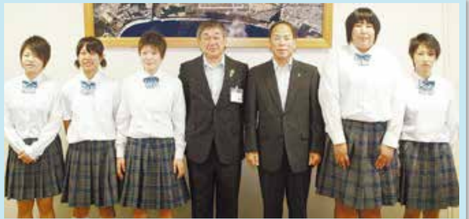
矢本第二中学校女子柔道部の5人の選手が、第36回東北中学校柔道大会(8月7～9日、青森県八戸市)・第44回全国中学校柔道大会(8月17～21日、三重県伊勢市)に出場することになりました。出場枠が少ない全国大会の団体戦に市内の生徒が出場するのは50年ぶりです。選手たちは健闘を誓いました(8月1日、市役所)