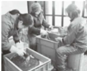
余計な根を切り洗浄。翌日のつる編みがますます楽しみに。