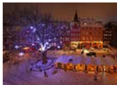
▲デンマークの街を彩るイルミネーション

前回に続いてクリスマスのお話。サンタクロースはデンマーク語で“Julemand”といい、グリーンランド出身です。毎年、子どもたちはこのユールマンへ願いごとを書いた手紙を送ります。厚紙をハートやサンタクロース、トナカイなどの形に切り抜いて飾るのもデンマーク流。またシーズン中に街中で開かれるクリスマスマーケットでは、キャンドル、陶器、食器、タペストリー(壁掛けなどに使われる室内装飾用の織物の一種)、アクセサリなどさまざまな商品が並びます。Gloggと呼ばれるホットワインが売られ、これを片手に買い物を楽しんでいます。