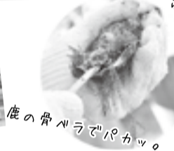
殻の骨ペラでパカッ。