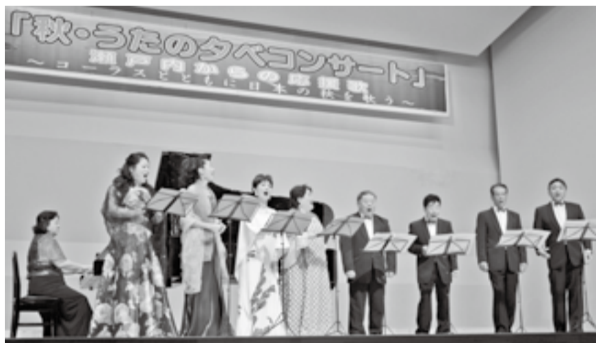
▲市芸術文化振興会が主催した広島県福山市のふくやま日本歌曲塾の皆さんによる「秋・うたのタベコンサート」(2013年10月4日、市コミュニティセンター)