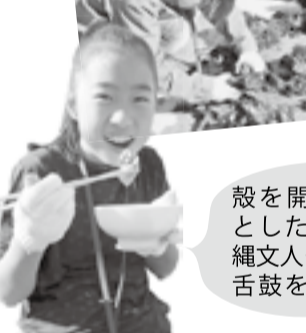
カキを縄から外します。

「カキ養殖体験～収穫～」を開催しました。4月に参加者さんが里浜の海に吊るしたカキは大きく成長し、一縄から100個以上の収穫。今年は大漁でした!