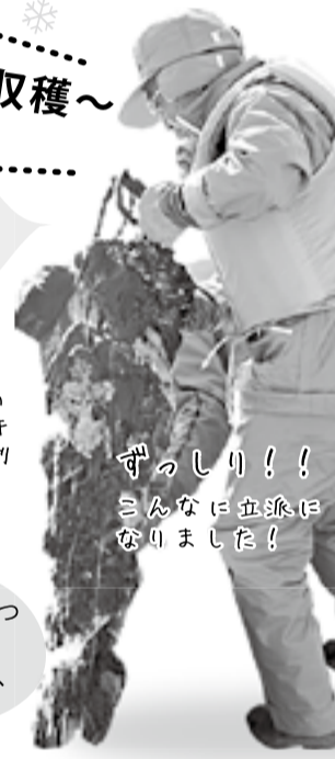
ずっしり!! こんなに立派になりました!

殻を開けると、潮の香りとぷりっとした新鮮な身が...! 縄文人も食した奥松島の海の恵みに、舌鼓を打ったのでした。