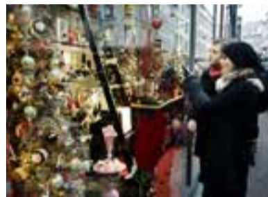
▲街中でクリスマスマーケットが開かれます

震災後、東松島市は北欧のデンマーク王国からさまざまな支援をいただいています。デンマークがどのような国なのか、毎月1日号で紹介(連載)していきます。