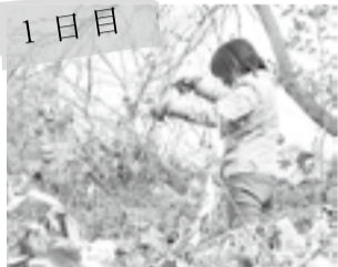
さとはま史跡公園で地中からつるを掘り起こし、採集。