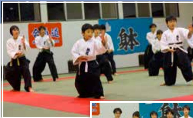
▲気合いを込めて形の練習に励みます