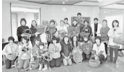
それぞれ味がある、素敵な作品が完成しました!