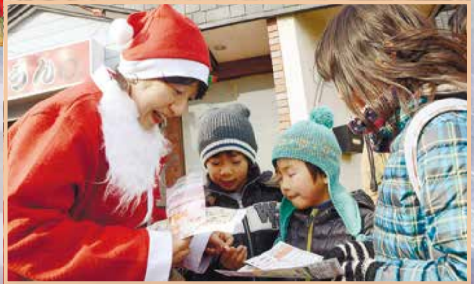
◀ クリスマスプレゼントが楽しみに、サンタクロースからスタンプをもらおう子どもたち