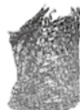
三内丸山遺跡出土「縄文ポシェット」

縄文時代、すでに植物のつるや樹皮を使ったカゴが作られていました。縄文人は素材の特徴を生かして、編み方やカゴの種類を作り分けていたようです。