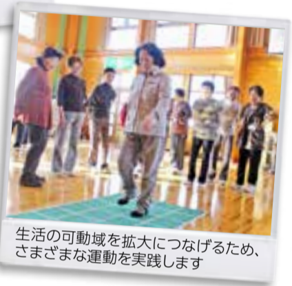
生活の可動域を拡大につなげるため、さまざまな運動を実践します