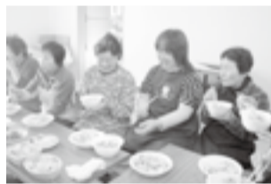
▲おいしい豚汁や赤飯を囲み、笑顔の花が咲いた交流会