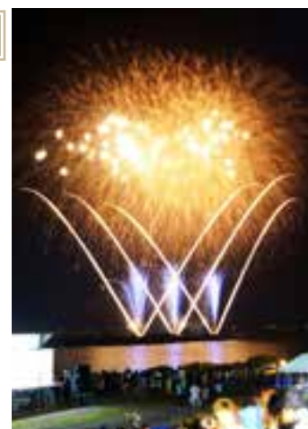
▲昨年の東松島市鳴瀬流灯花火大会(8月16日)