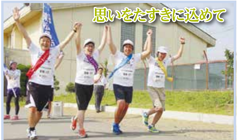
思いをたすきに込めて

大塩地区ソフトボール大会には1部と2部に合わせて12チームが参加し、予選リーグから熱戦が繰り広げられました。大会は今年で40回目の節目ですが、自治会制度導入に伴い大塩自治協議会が共催となったことから、リニューアルして第1回大会となりました(7月27日、鷹来の森運動公園)