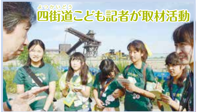
よっかいどう 四街道こども記者が取材活動

鳴瀬子育て支援センター「あいあい」で、1歳半以上の子どもとその保護者を対象にした子育て講座「楽しい親子リトミック」が行われました。リトミックは、ピアノや音楽に合わせて体を動かす教育法です。リズムに合わせて、親子でボールや器械を用いた簡単な運動をしました(7月15日、小野市民センター)