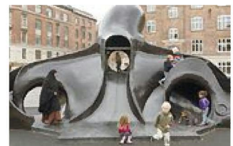
▲コペンハーゲン市、Superkilen公園内にある黒いタコのすべり台

首都コペンハーゲン市内にあるユニークな公園「Superkilen」。デンマークを代表する建築事務所、アーティスト集団、ベルリンのランドスケープデザイン事務所が共同で手がけたこの公園は、さまざまな異なる文化を背景にもつ住民の多い地区にあります。その始まりは住民へのヒアリングから。住民から出身国の「記憶」を聞き出した結果、オーストラリアのハンモック、アフガニスタンのブランコ、アルゼンチンのバーベキューグリル、ジャマイカのサウンドシステムなど、57か国から108種類のアイテムが配置されることに。ちなみに公園内にはタコの滑り台があり、日本から職人を招いて制作されました。特に人気の高い遊具になっているそうですよ。