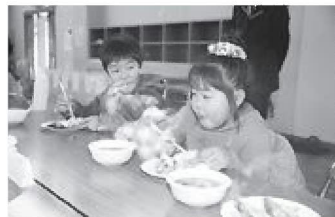
▲特産品の米、野菜、果物に加え、焼がき、のり汁も食べて栄養ばっちりです

小野地区体育館に設置された食育コーナーでは、市食生活改善推進員の皆さんによる地元でとれた特産米(かぐや姫、はたる米)の試食や地場産野菜のピュッフェなどが並びました。特に矢本産のイチゴにチョコレートで顔を描いたかわいいうスイーツは子どもたちに大好評。健康づくりコーナーではヘルシークイズや