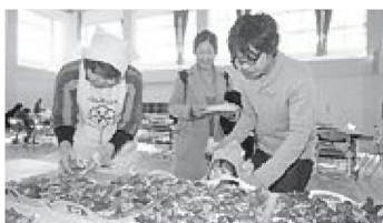
▲会場となった小野地区体育館には多くの親子連れが訪れ、にぎわいました

12月7日(日)に小野市民センターで行われた「環境未来都市」構想国際フォーラムには、「未来を担う子どもたちに、パパママからよい生活習慣をプレゼント」をテーマに「親子の食育と健康づくり」ブースが設けられ、約300人の参加者でにぎわいました。