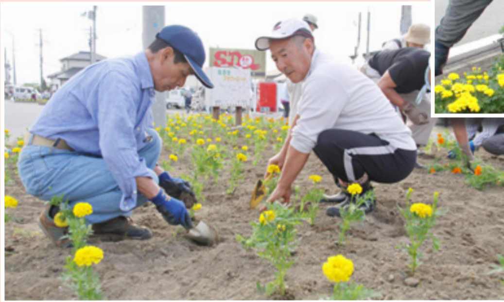
JR小野駅前など鳴瀬地区の12行政区が管理する花壇にマリーゴールド約1万5千本が植えられました。早朝の作業でしたが、約350人が参加し、地域を花で彩りました。(6月21日、JR小野駅前)