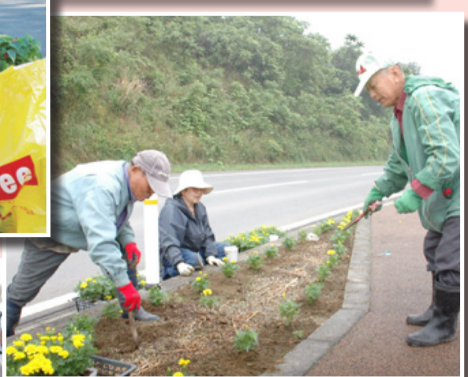
宮戸コミュニティ推進協議会では、県道沿いの花壇にマリーゴールドの苗約3,500本を植えました。(6月13日)