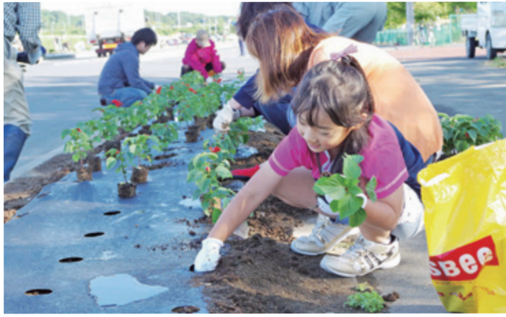
上街道フラワーアベニュー推進協議会では、矢本西地区住民約800人が参加して県道矢本河南線緑地帯にサルビアの苗約15,000本を植えました。(6月7日)

きれいな花で地域を彩ろうと、「花の香るまちづくり事業」の一環として市内各地区では道路沿いの花壇で植栽活動を行いました。市民総出の作業であり、朝早くから多くの人たちが協力し、サルビアやマリーゴールドの花苗を丁寧に植えました。夏になれば花壇はたくさんの花で覆われ、ドライバーや歩行者の目を楽しませてくれます。