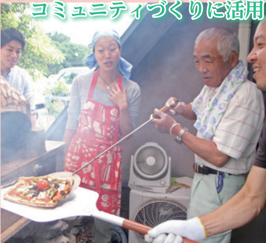
宮戸地域内の食堂「げんちゃんハウス」に本格的なピザ窯が完成し、火入れ式が行われました。会場では仙台市のイタリアンシェフを講師に招いてのピザづくり研修会も行われ、関係者たちは地元産のワタリガニやノリがふんだんに入ったピザを試食しました。今後は食を通じたコミュニティ形成にピザ窯を活用していく予定です。(6月18日、げんちゃんハウス(奥松島縄文村内))