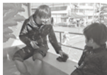
▲足湯を楽しみながら東松島のことを語り合いませんか。

フェイスブック URL: http://www.facebook.com/hmhope.org