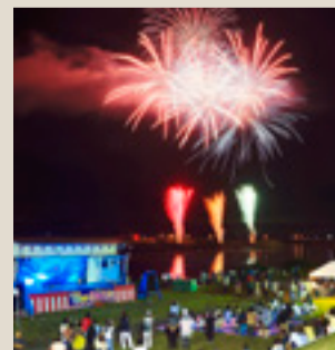
◀ 昨年の東松島市鳴瀬流灯花火大会(8月16日)