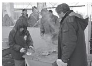
▲イベントなどで提供する「カキ汁」は地域内外を問わず、高い人気を集めています

東松島市は自然が豊かで、おいしい水産品や野菜が採れる食のまちです。地元食材の魅力を伝えるとともに、今後は生産業者の方々のPRにも力を入れていきたいと考えています。