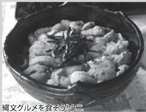
縄文グルメを食そう!ウニ