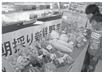
▲新鮮な野菜が多く並ぶ「いなショップ・グリーン」