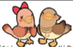
グーチちゃん がん助くん 宮城県がん征圧イメージキャラクター

※次の項目に該当する方は、乳がん検診を受診できません。必ず申し出てください。 ・妊娠中の方、または妊娠している可能性がある方 ・授乳中の方、及び断乳後1ヶ月未満の方 ・豊胸手術を受けている方 ・乳腺のことで治療中または経過観察を受けている方 ・ペースメーカーを装着している方 ・頭の手術によりV-Pジャントを受けた方