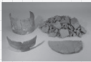
薄くて小さい製塩土器

今回の発掘調査では、平安時代の初め頃(9世紀代)の製塩炉が見つかりました。入り江のやや高い場所を選んで、3ヶ所で同時に作業が行われていたことが明らかになりました。炉には凝灰岩を用いた石組み炉と漆喰状の練り物炉があり、石組みから漆喰状のものへと変化したようです。