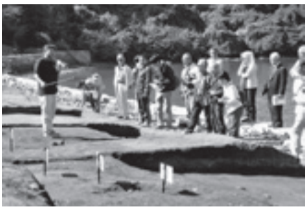
↑製塩炉の説明に耳を傾ける聴講者たち。

10月17日(土)、宮戸島「江ノ浜貝塚」の発掘調査の成果を発表する「現地説明会」を開催しました。