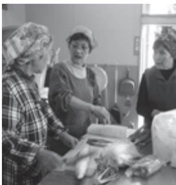
▲東松島市地域生産物加工研究会の講習会では、調理実習を通して農産物などの加工技術習得に励みます

私たちの活動が、地域の皆さんの食生活改善の一助になり、またおいしい地場産品を知る一つのきっかけになればうれしいです。