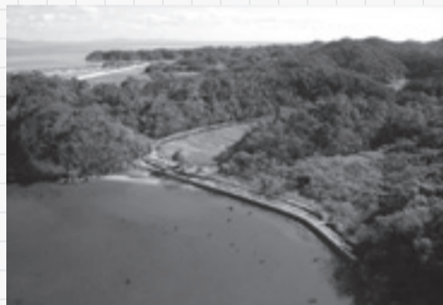
遺跡全景(奥が石巻湾)

その中でも江ノ浜貝塚は、その製塩の規模や出土遺物の内容からみて、松島湾岸の製塩遺跡群のなかでも、中核的な施設であった可能性が推測されます。