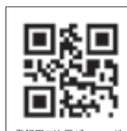
登録用二次元バーコード

http://www.city.higashimatsushima.miyagi.jp/mail_service/