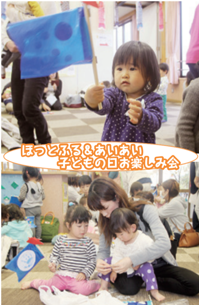
ほっとふる&あいあい 子どもの日お楽しみ会

「CityView!」では、市のイベントや地域的话题を、皆さんにお届けします。 <掲載した写真は、データで提供します。希望の方は問い合わせください。>