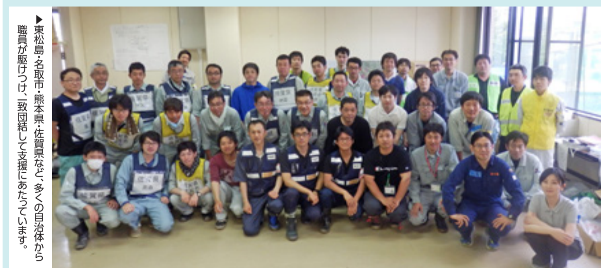
▶東松島名取市 熊本県・佐賀県など、多くの自治体から職員が駆けつけ、致団結して支援にあたっています。