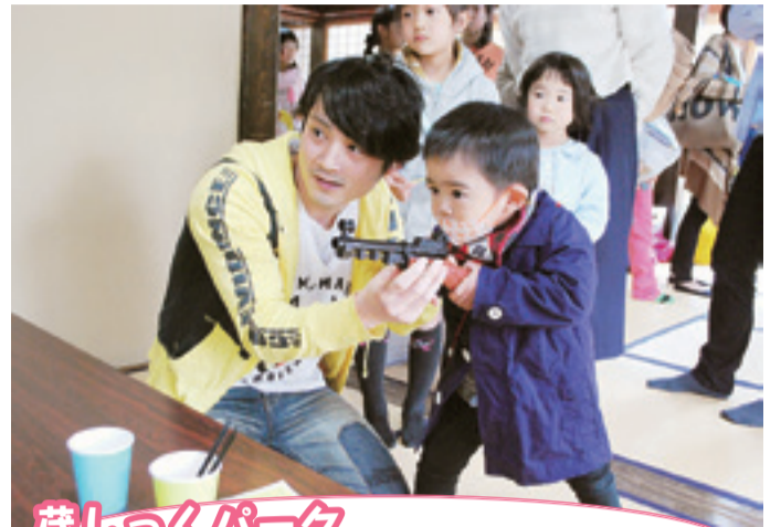
蔵しっくパーク くらっぱランド～こどもの国～