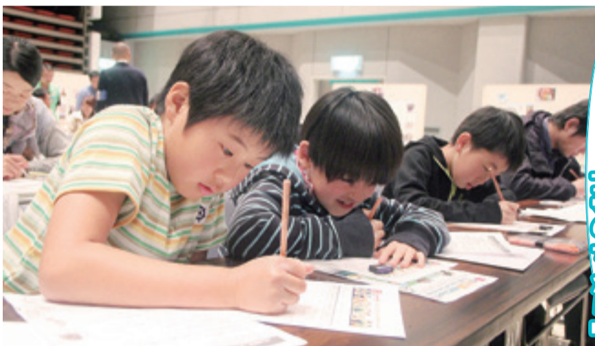
来て!見て!学ぼう! 「夢のちから」