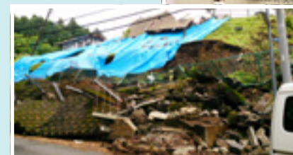
▲布田川断層の上に位置する住宅の多くが倒壊・崩落・滑落などの被害を受けました。

現地では、多くの方が厳しい避難生活を続けています。西原村をはじめ、被害を受けた熊本県の一日も早い復興のため、今後もさまざまな面で支援を行っていきます。