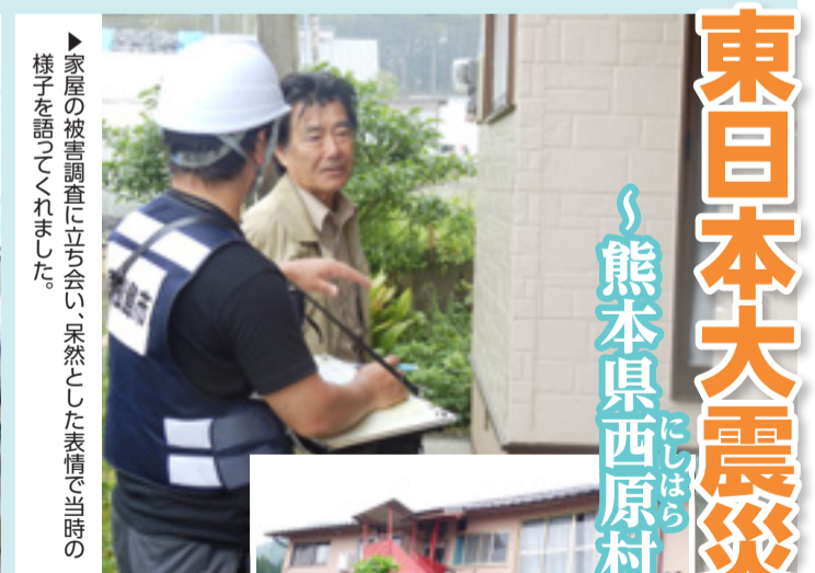
▶家屋の被害調査に立ち会い、突然とした表情で当時の様子を語ってくれました。