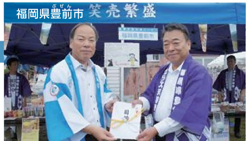
福岡県豊前市 笑売繁盛