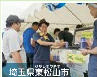
ひがしまつしま 埼玉県東松山市