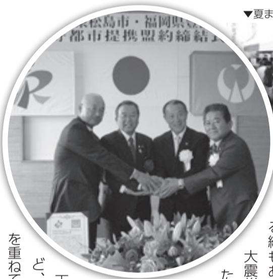
▼夏まつりにて、豊前市が出店

5月8日、福岡県豊前市と友好都市提携盟約を結びました。豊前市の特産である「豊前海一粒かき」の稚貝を東松島市から提供している縁もあり、東日本大震災で被災した漁師へ支援をいただきました。東松島夏まつりや豊前市カラス天狗祭りなど、毎年交流を重ねています。