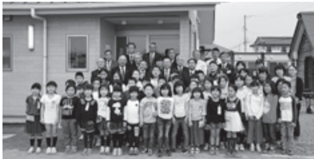
▲新しいひまわり放課後児童クラブ