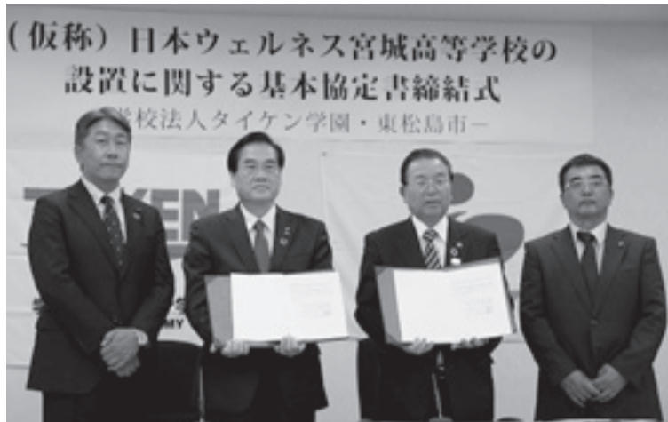
(仮称) 日本ウェルネス宮城高等学校の 設置に関する基本協定書締結式 学校法人タイケン学園・東松島市

10月30日、学校法人タイケン学園と全日制私立高校に関する基本協定を締結しました。高校誘致は地域経済や人口減少対策、創造的復興につながるものであり、現在平成32年4月の開校を目指して諸手続きを進めています。