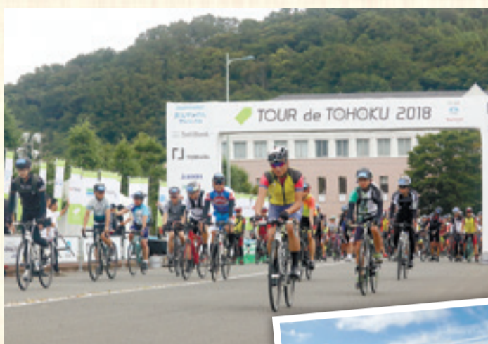
▲ツール・ド・東北2018参加者が奥松島へ向けてスタート ▶オルレコースの大高森からの風景 ▼オルレコースを楽しむ人々