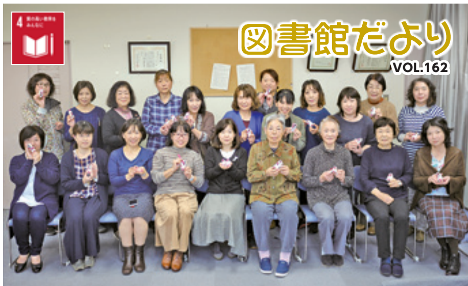
▲「エコクラフト講座」に参加した皆さん(11月7日)