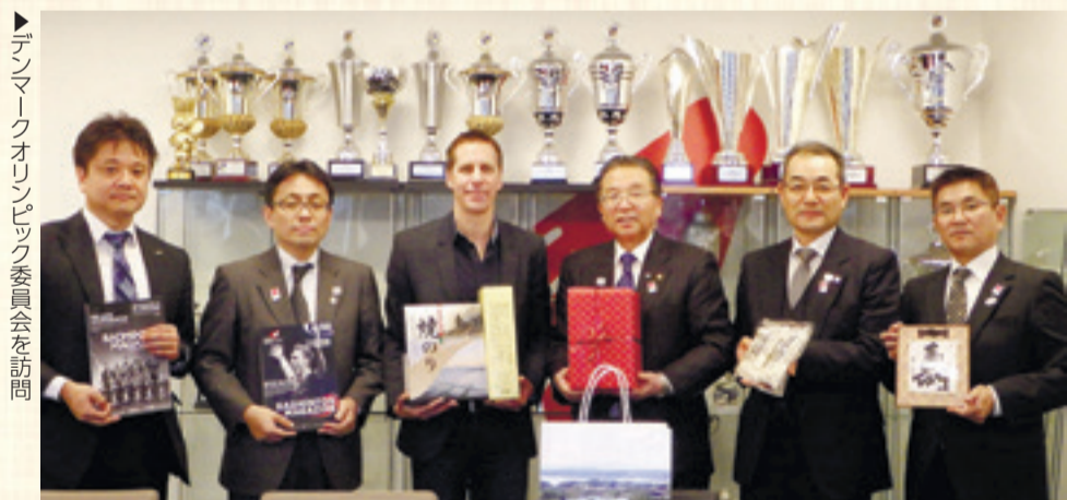
▶デンマークオリンピック委員会を訪問