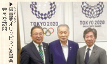
▶森喜朗オリンピック委員会会長を訪問