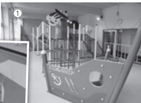
◀新たにオープンした小野地区ふれあい交流館

旧野蒜小学校を改修した防災体験型宿泊施設「こども未来創造校KIBOTCHA」が7月21日にグランドオープンしました(写真①)。