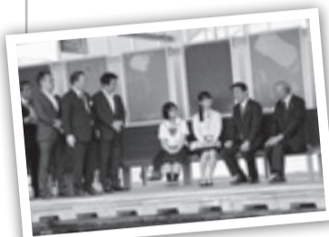
▲安倍首相、吉野前復興大臣に自身の経験を話す語り部

8月2日、安倍晋三内閣総理大臣と吉野正芳前復興大臣が東松島市を訪れ、市の復興を支えている派遣職員を激励したほか、赤井のイグナルファームや東日本大震災復興祈念公園を訪れ復興状況などを聞きました。10月には、新たに就任した渡辺博道復興大臣と、橘慶一郎復興副大臣、塚田一郎復興副大臣が来訪し、現状報告や要望を受け同公園を視察しました。