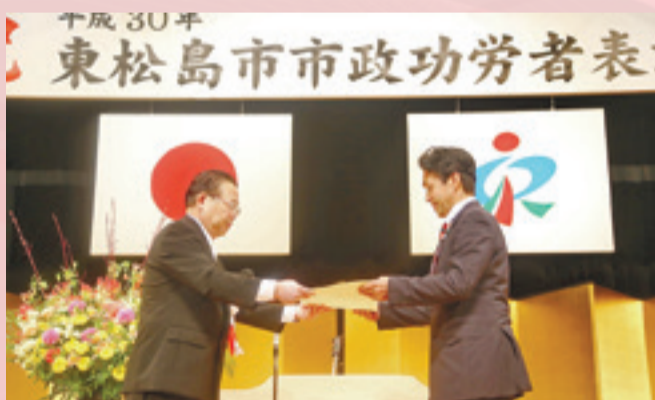
▶渥美市長が受賞者代表に表彰状や感謝状を手渡しました