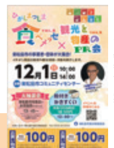
◀ お買い物券付き案内はがき

市内各市民センターなどに、当日会場でするお買い物券付き案内はがきを設置しています