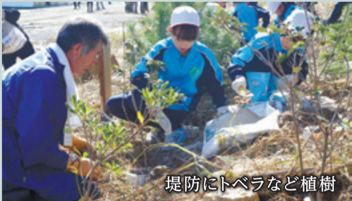
堤防にトベラなど植樹

住友林業株式会社の奥松島自然再生ボランティアによる植樹が野蒜地区で行われました。減災のために設けられた堤防ののり面に、宮野森小3年生や県内外からのボランティア約140人がトベラやマルバシャリンバイ、シロダモなど630本を植樹。今後も植樹や管理を継続し、震災以前のような自然の再生を目指します。(10月23日、野蒜洲崎地区)