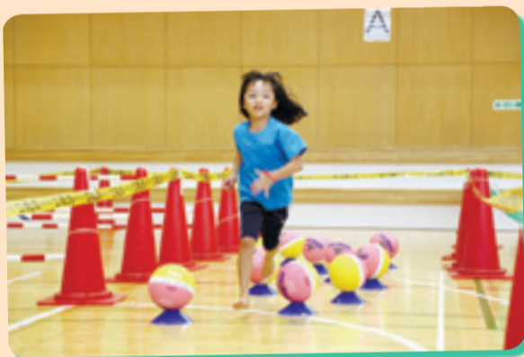
障害物競争でタイムを競う「ミニクロカン!フィールドクロス」は子どもたちに人気。(大曲地区体育館)