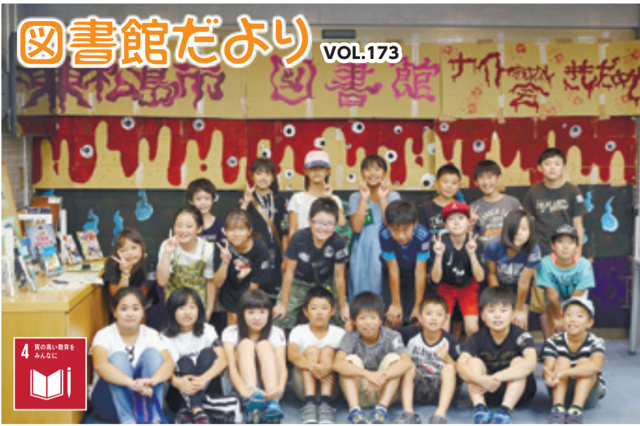
▲「ナイトおはなし会&きもだめし」に参加した皆さん(8月10日)