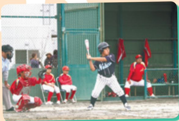
若鷹旗争奪少年野球大会では球児たちが全カプレーで躍動しました。(鷹来の森運動公園屋外野球場)

世代間交流のスポーツイベント「第27回リフレッシュフェスティバル」が開かれ、市民の皆さんが健康づくりに励みました。 台風19号の影響で、1日目(10月13日)の開催は見送られましたが、2日目(14日)は、市内各運動施設でさまざまな催しが繰り広げられました。