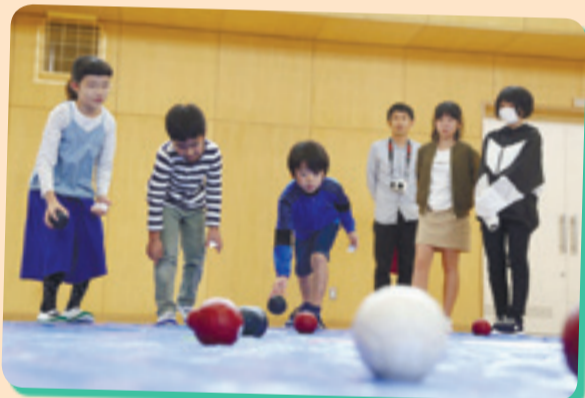
パラリンピック正式種目の「ボッチャ」が体験できるブースも設置され、多くの子どもたちが挑戦しました。(大曲地区体育館)