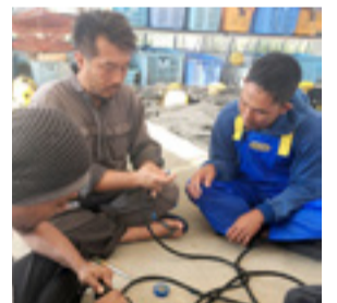
▲定置網漁業のロープ刺し技術指導

市は、スマトラ沖大地震・インド洋津波を通じて被災した共通の経験を持つインドネシアのバンダ・アチェ市と「相互復興」の取り組みを2013年から進めています。取り組みの一環として、HOPEでは9月29日から約