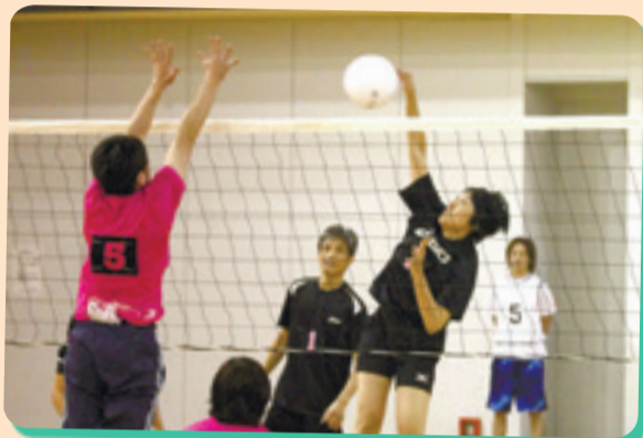
東松島市クラブ対抗家庭バレーボール大会では白熱した試合が展開されました。(市民体育館)