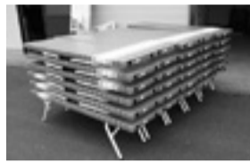
◀助成により整備したホームベンチ