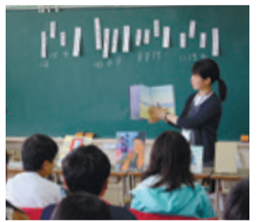
▲「小学校6年生」テーマ:古典

希望のあった学級学年に図書館司書が出向き、テーマに沿った本の読みきかせや紹介を行います。学習内容の理解を深め、さらに本のおもしろさを伝えるための読書推進活動です。