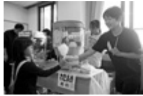
◀まるごと大曲ふれ愛まつりの様子