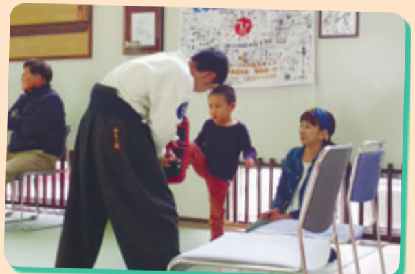
剣道体験教室に参加した子供たちは、楽しく全身を動かし、礼儀作法についても学びました。(矢本運動公園 武道館)