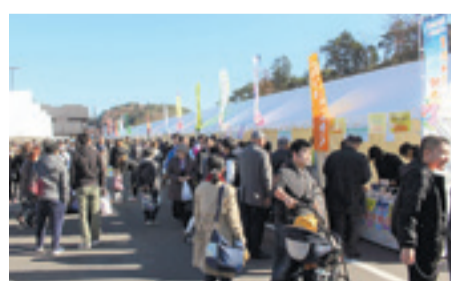
◀ 昨年のPRブースの様子