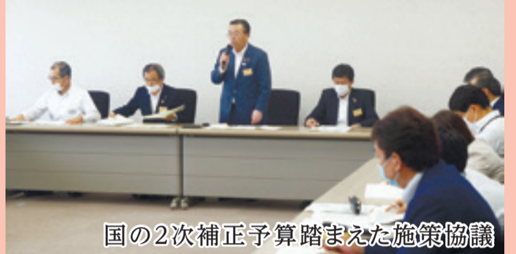
国の2次補正予算踏まえた施策協議

第30回の東松島市新型コロナウイルス感染症対策本部会議では、休業要請に対する協力金などの交付状況を確認したほか、国の第2次補正予算で行う市の施策を協議しました。感染拡大の第2波に備え、石巻保健所から講師を迎えた2度目の研修会を開くことも確認しました。 (6月24日、市役所)