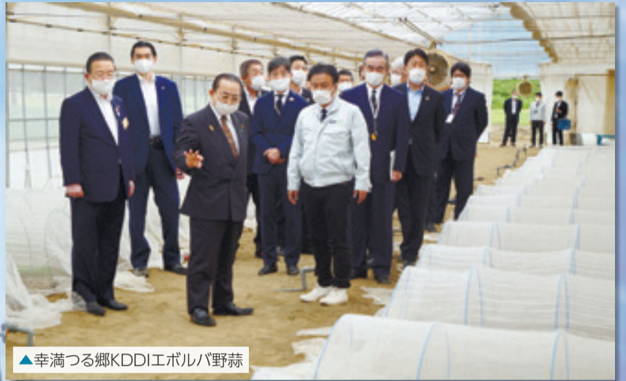
▲幸満つる郷KDDIエボルバ野蒜