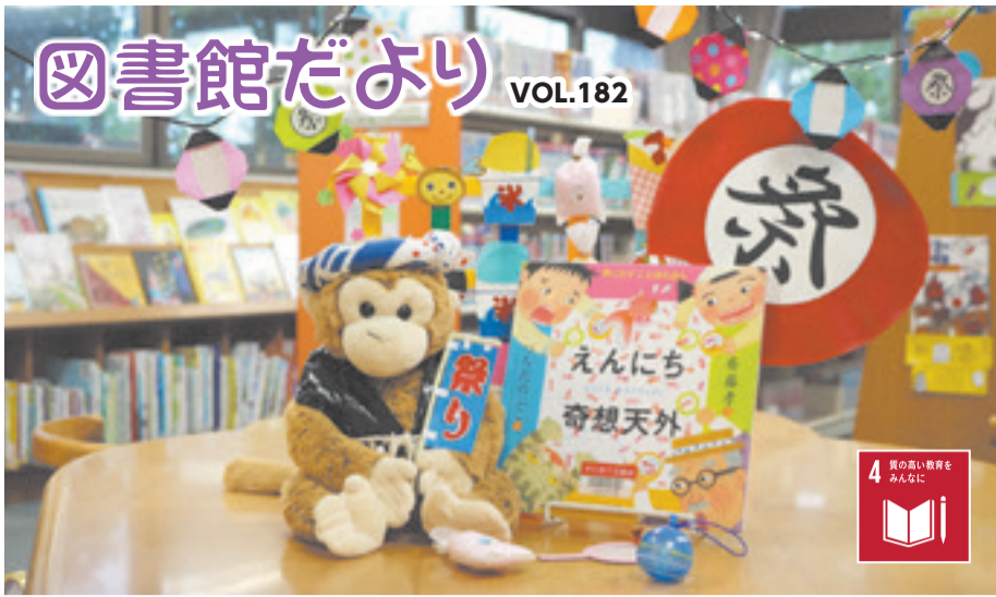
▲「わっしょいわっしょい」(お祭りのディスプレイが館内のあちこちに)