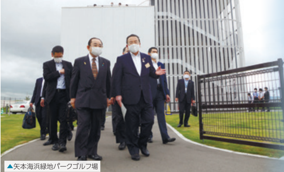
▲矢本海浜緑地パークゴルフ場