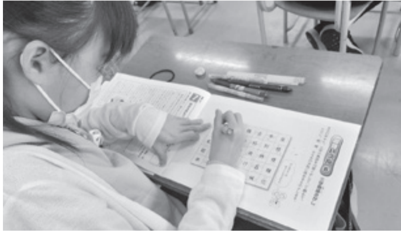
スキルタイムに臨む児童たち

の考えを伝え、相手の発表から気付きを得られるような機会を作っています。主体的な学習方法を取り入れたことで、子どもが生き生きしている様子が感じられます。