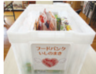
▲ひだまりの里に設置されているフードボックス

「フードドライブ」は、いただきものや買いすぎて家庭に眠っている食品を、必要としている人たちに提供する活動です。ひだまりの里でも、フードボックスを設置して地域住民の皆さんに協力をお願いしています。