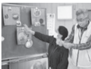
▲クイズ形式でバランスの良い献立を考える参加者