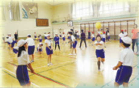
学習・部活動支援

「地域でどのような子どもたちを育てるのか」、「何を実現していくかという目標やビジョン」を地域の皆さんと共有し、地域と一体となって子どもたちを育みます。