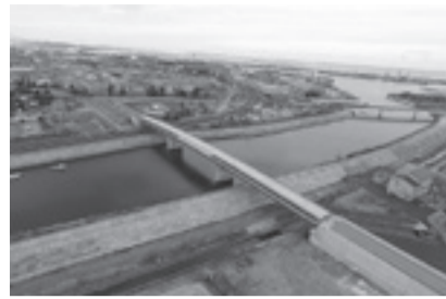
定川復興大橋(令和3年1月撮影)