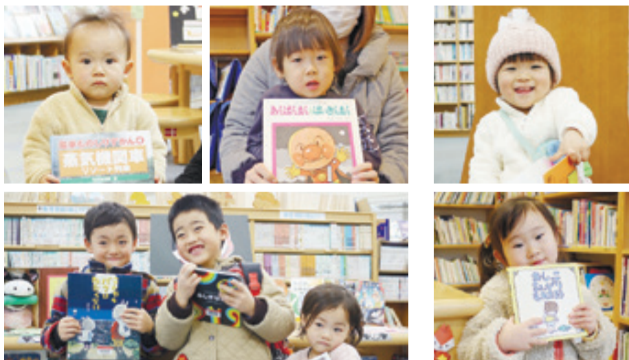
▲1回目ゴールおめでとう

12月26日～1月15日までの間に13組のお友達がゴールしました。みんなおめでとう!