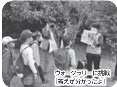
ウォークラリーに挑戦「答えが分かったよ」