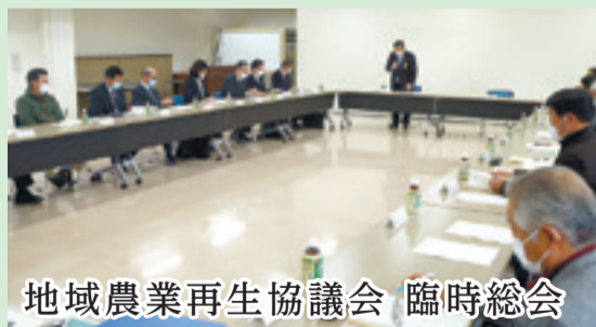
地域農業再生協議会 臨時総会

東松島地域農業再生協議会の令和2年度第1回臨時総会が開かれ、東松島市における令和3年産主食用米の「生産の目安」を1,828ha(面積換算、前年度比で50haの減)に決めたほか、令和3年度における水田農業への取り組みなどを申し合わせました。コロナ禍における経済的影響は農業分野にも広まっており、主食用米の需給バランスと米価安定を目的に戦略作物(転作作物)の作付拡大を進め、持続可能な農業の仕組みづくりについて情報共有を行いました。(2月22日、市役所)