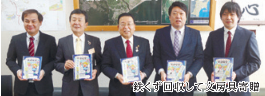
鉄くず回収して文房具寄贈

県トラック協会石巻支部青年部会から、社会貢献活動の一環として、各事業所から鉄くずを回収した収益金をもとに、令和3年度入学予定の新一年生用にノートと定規を寄贈されました。昨年7月・11月の2回にわけ、加盟事業所から約30tの鉄くずを回収。通学時の安全を訴える交通安全仕様のノートを本市に届けました。(3月1日、市役所)