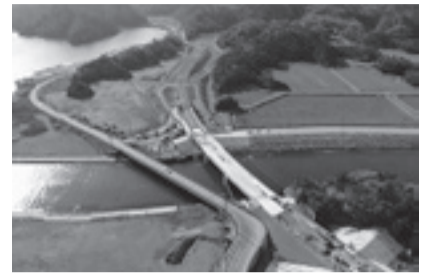
松ヶ島橋(令和3年1月撮影)