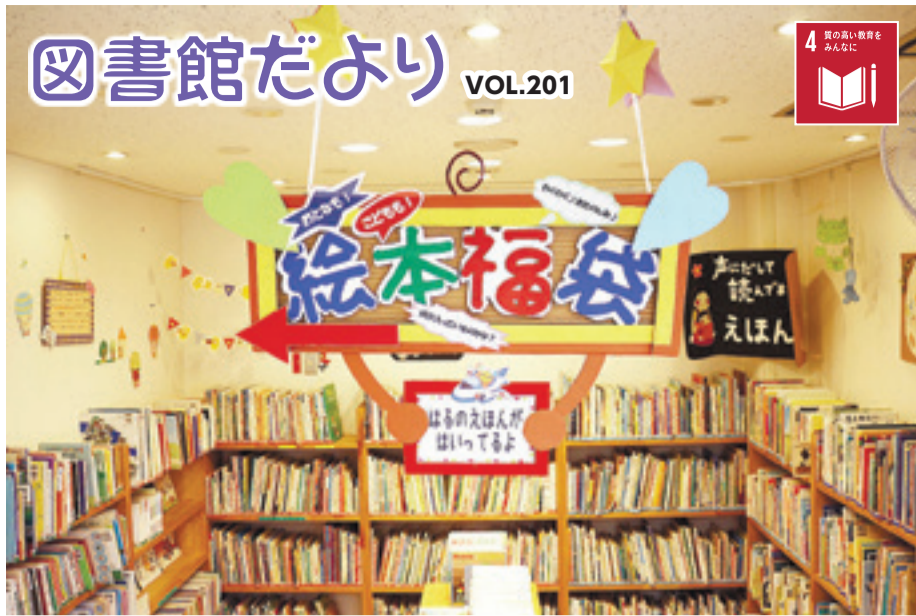
▲絵本も春に衣替えしました