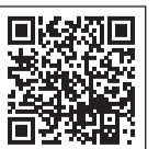
事業復活支援金事務局ホームページ