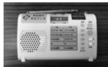
新しい戸別受信機