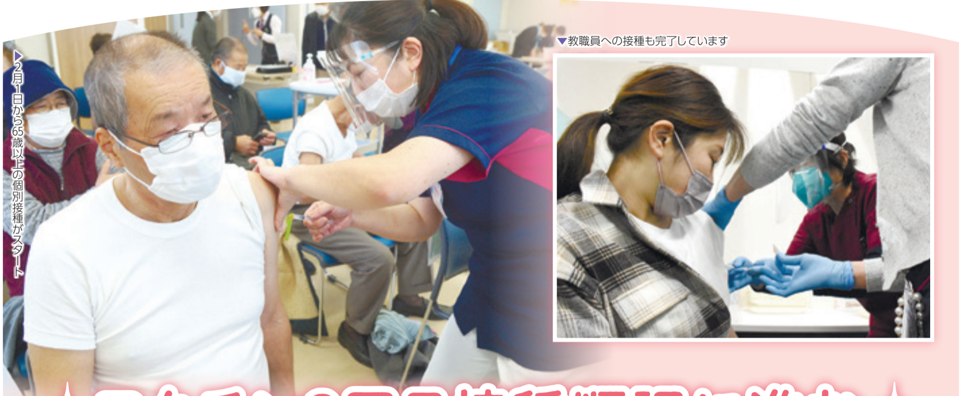
▼教職員への接種も完了しています