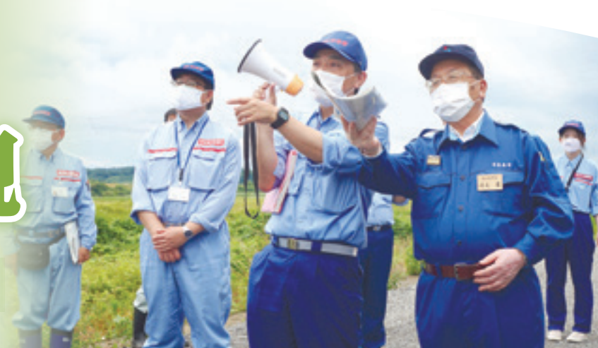
▲渥美市長ら水防団員が注意箇所を視察しました

その後、吉田川右岸のもしもしピット付近(川下地区)の掘削護岸を視察。渥美市長は「本市は1級河川の鳴瀬・吉田川と、2級河川の定川を有しており、危険箇所をしっかりと確認した上で、関係団体連携で有事に備えたい」と呼びかけました。