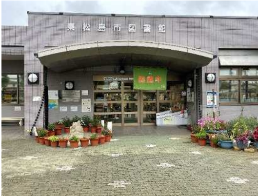
図書館正面玄関前

展示期間：令和3年7月8日から10月24日開催の図書館まつりまで予定 (天候等により前後する場合がございます。)