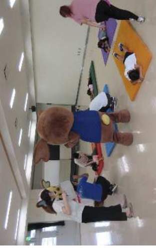
イートくんチャンネルの幼児運動の動画撮影風景の写真