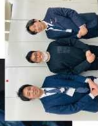
真の目利き・販売