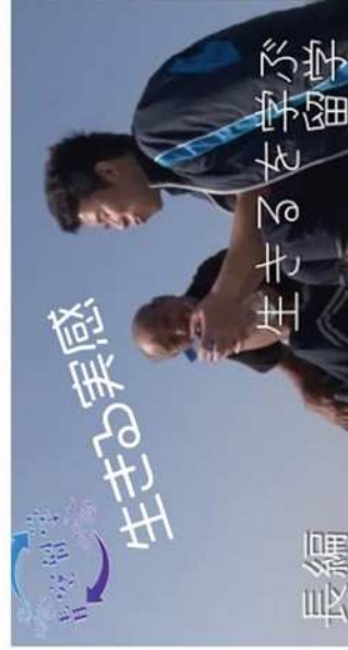
生産物の研究・開発