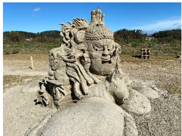
▲ 3位「ラッセーラ」武政登氏作