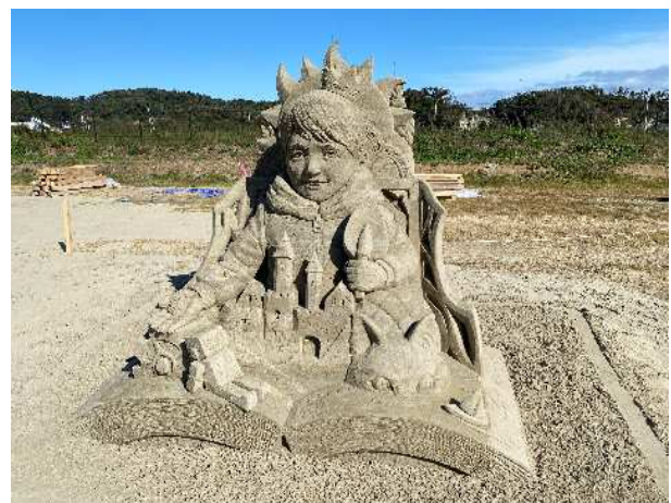
▲ 優勝「夢の創造」保坂俊彦氏作