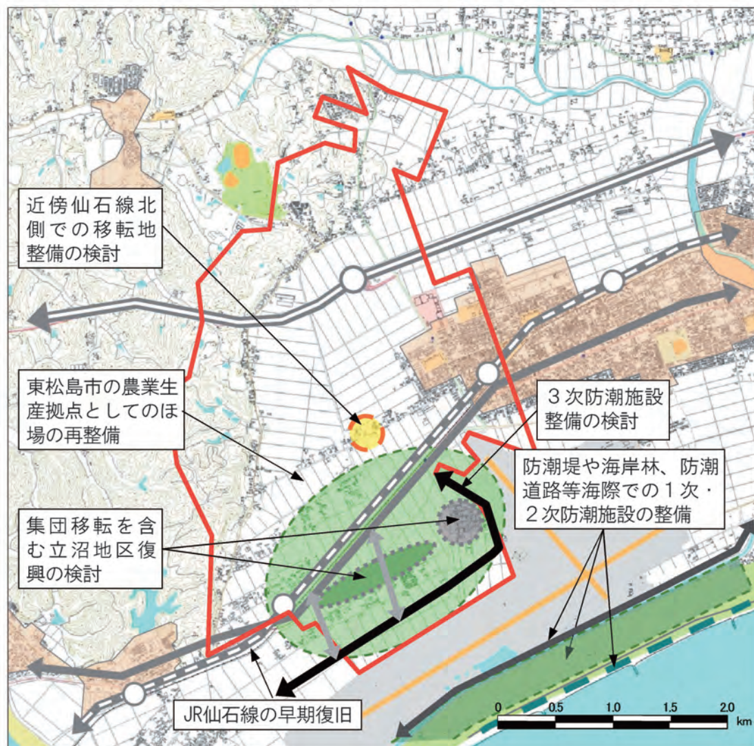
[ 矢本西地域の復興方針図 ]

他地域と同様、立沼・鹿妻地域や市街地については、多重防災構造の整備を推進します。