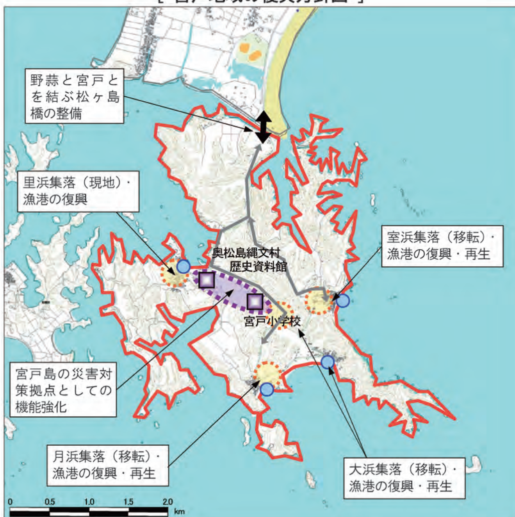
[ 宮戸地域の復興方針図 ]

大きく被災した3つの集落においては、背後丘陵地を活用した移転復興を基本としつつ、緊急時の避難手段の確保を推進します。