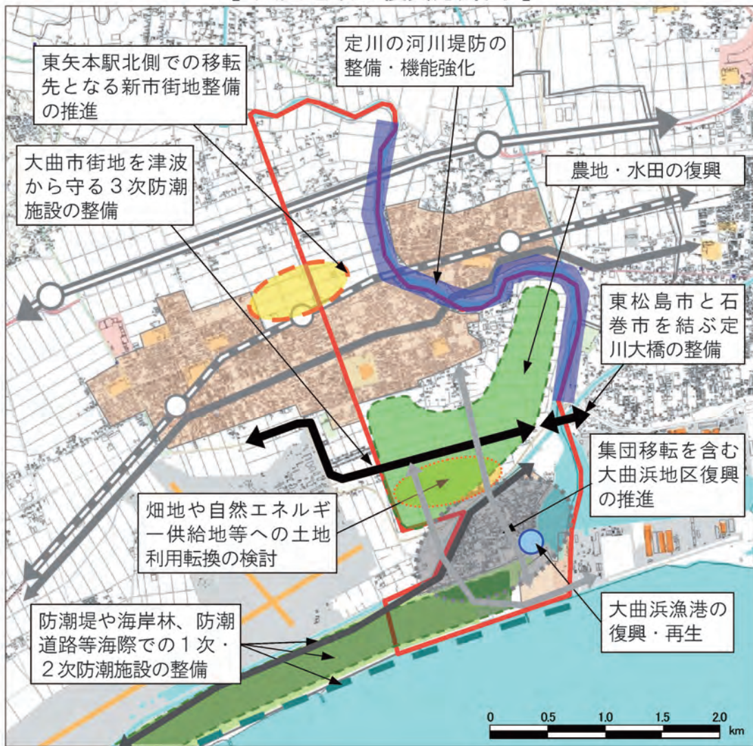
[ 大曲地域の復興方針図 ]