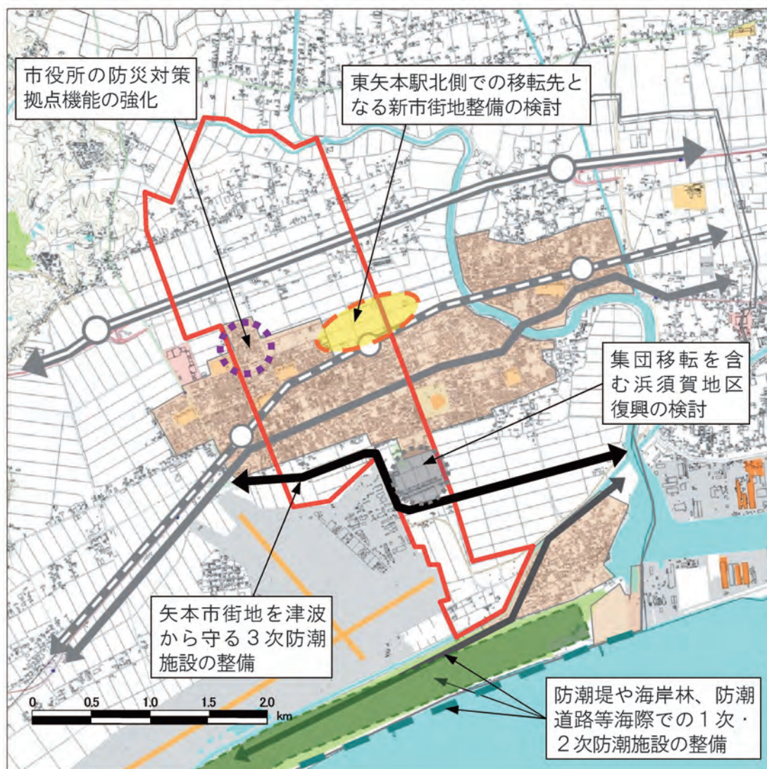
[ 矢本東地域の復興方針図 ]

また、住民意向として現地での復興を要望している方もおり、浜須賀地域を含む市街地については、海岸堤防の整備（一線目）や北上運河付近での内陸型堤防（二線目）の整備に加え、かさ上げ道路・内陸堤防等（三線目）を整え、多重防災構造の整備を推進します。