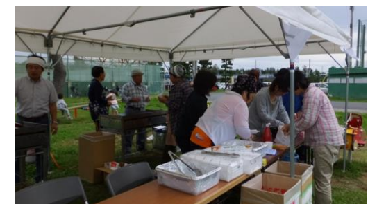
フランクフルトの販売 (協議会役員が協力)

屋台のブースでは、まちなどによる牛タンつくね、自治会によるフランクフルトの販売が行われ、どちらも盛況のうちに完売となりました。