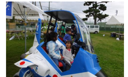
ブルーインパルスジュニアに乗る子供たち

また、会場にはブルーインパルスジュニアによる車両展示のブースも設けられ、子供たちは車両に乗って記念撮影をしていました。