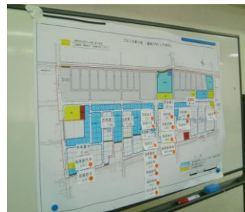
最終ブロック決定会：途中経過

部会および役員会での決定を踏まえ、10月13日(日)に最終ブロック決定会を開催しました。当日は、ブロック未決定世帯25世帯のうち、23世帯