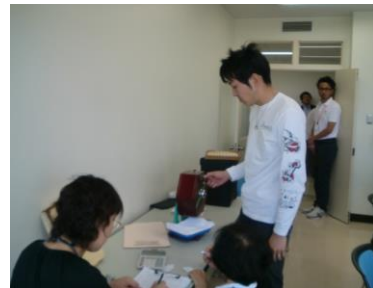
ブロック調整会：抽選の様子

9月29日(日)に希望が超過している4ブロックの希望世帯を対象に、市役所301会議室でブロック調整会を行いました。