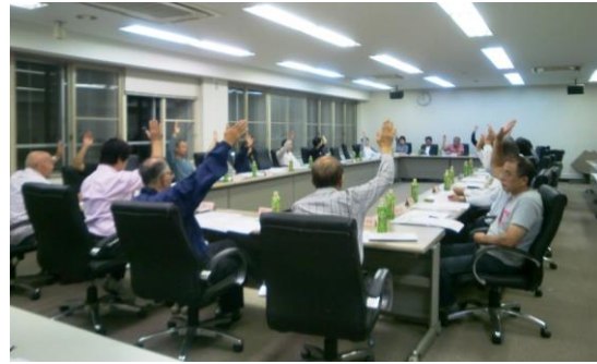
役員会での「最終ブロック決定会」開催の決議

このブロック未決定世帯について、当初は第1回と同様の手続きでブロック決めを行う想定でしたが、世帯数が多くなく、できるだけ早く全世帯のブロック決めをした方がよいとの判断から、10月1日(火)に区画決定ルール検討部会と役員会を開催して検討した結果、協議会として決めた第2回希望登録の流れは当初のままとするもの、対象者が一堂に会して1日で希望登録、変更登録、